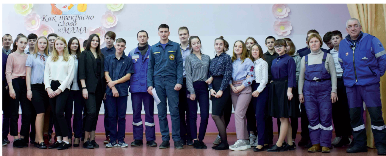
Старшеклассники узнали о профессиях, востребованных на ЛПДС «Демьянское».