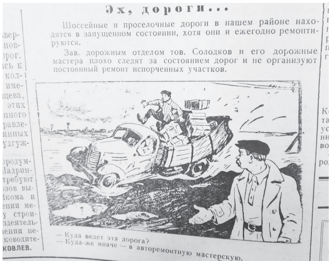
Газетные карикатуры помогли в решении проблем.

Если в начале десятилетия рубрик в газете почти не встречалось, они в основном были разовыми, то к концу их количество увеличилось, и они стали