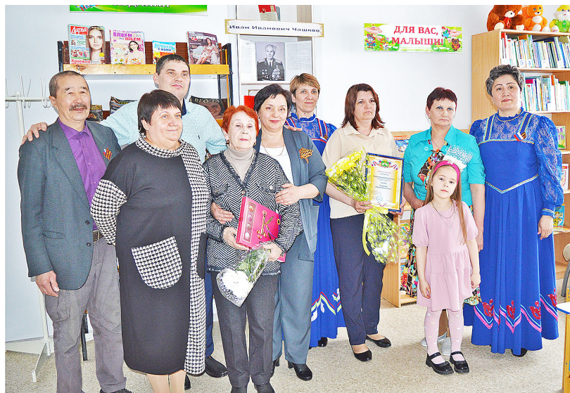
Чирковцы гордятся своим земляком и хранят память о нём