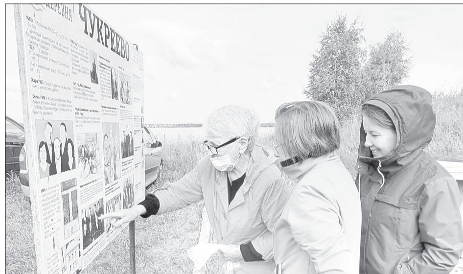
Об истории Чукреево можно почитать на стендах - здесь летопись деревни в фотографиях и фактах

Стела с именами земляков, не вернувшихся с войны, - вроде бы небольшое сооружение, но требует ухода: убрать ржавчину, нанести свежую краску, подклеить отвалившуюся плитку. Табличка с фамилиями вернувшихся участников Великой Отечествен-