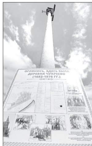
Совсем недавно установлена новая табличка с картой и старинными семейными фотографиями