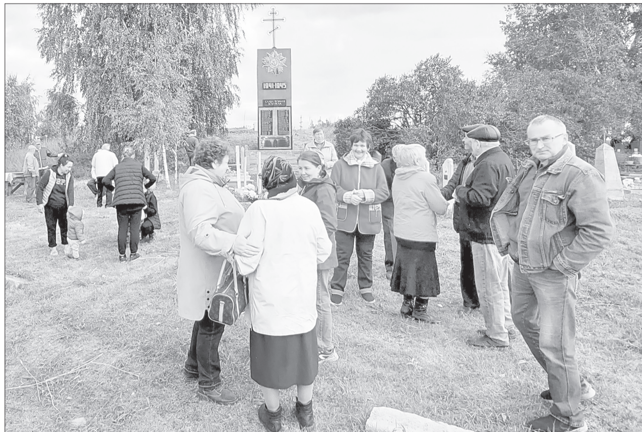
Приехать на встречу в последнее воскресенье августа стараются многие чукреевцы, ведь они как одна большая дружная семья

Хочется через «ЯЖ» поблагодарить тех, кто постоянно скашивает растительность. И не только на погосте, но и возле стелы. Отдельное спасибо