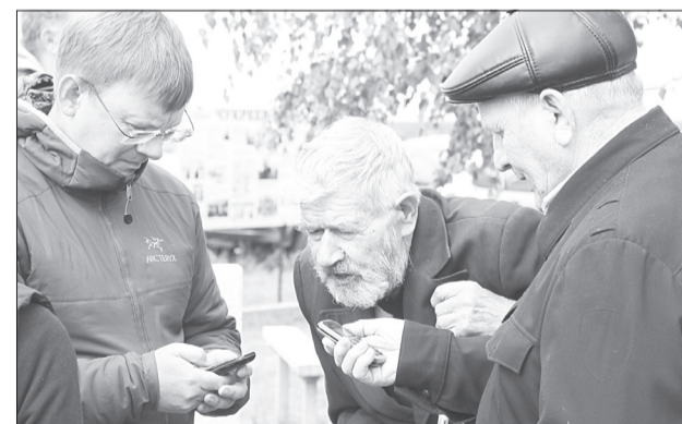
В конце встречи чукреевцы обменялись номерами телефонов

Хотелось бы поделиться планами на ближай-