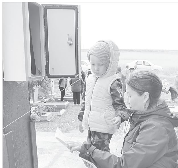
В герметичном ящике, установленном на обелиске, надёжно хранятся Книги Памяти. В них важная информация для потомков

Вот и прошла очередная встреча односельчан-чукреевцев, их родственников и тех, кто интересуется историей родного края.