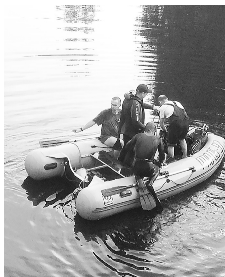
Внизу работают водолазы, на мосту – полтавды в ожидании. Если бы каждый подобный случай чему-то учил...

Лидия ЛЕБЕДЕВА с места события.