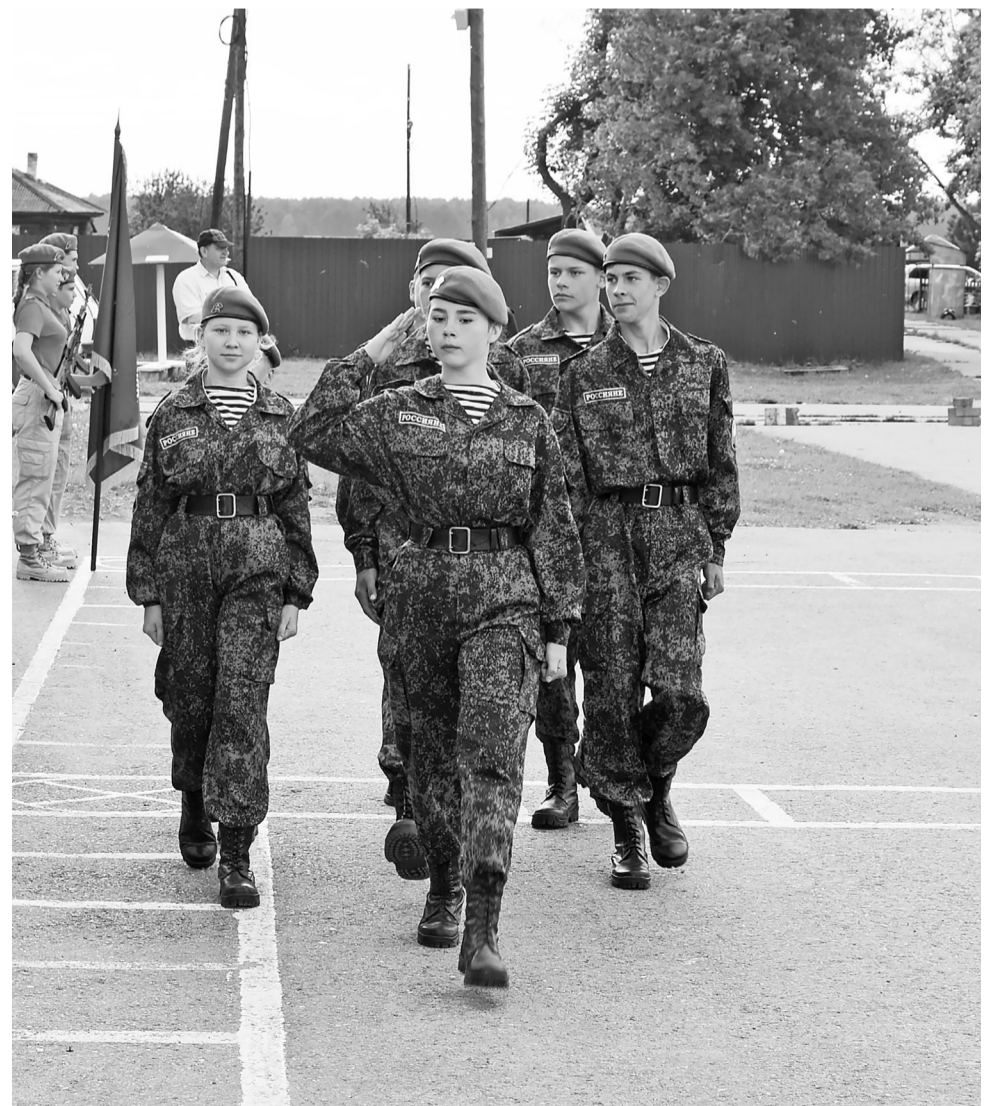
Строевым шагом на пути к дисциплине, укреплению силы духа и воли.

Затем палаточный лагерь начал жить по своему расписанию, а гости — потихоньку разъезжаться. Теперь ребятам предстоит прочувствовать на себе все тонкости армейской жизни. Для этого и