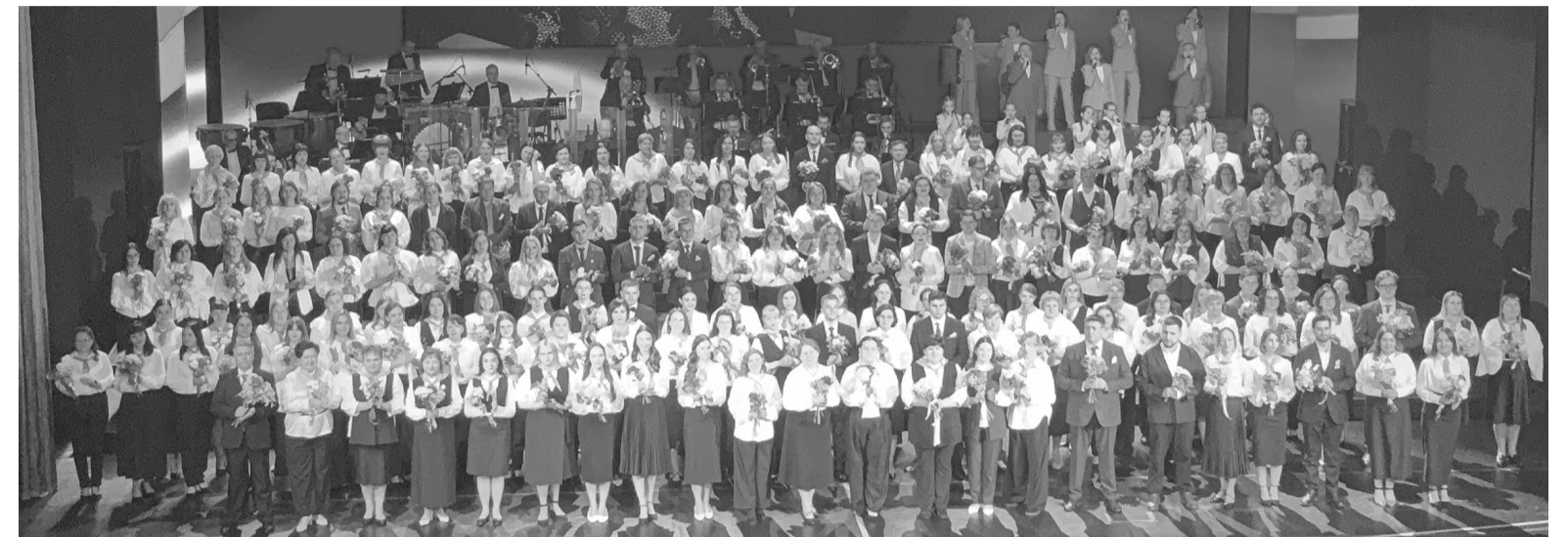
■ На снимке: 165 педагогов из разных уголков Тюменской области собрались в ДК «Нефтяник», чтобы доказать: профессия учителя — это призвание, талант и ежедневный труд