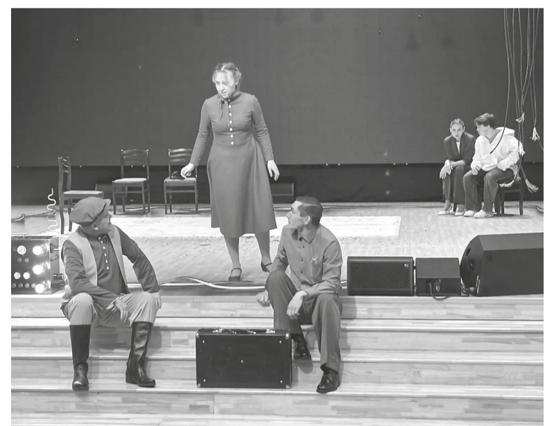
■ На снимке: театр «Ангажемент» на сцене ЦКР имени И. Т. Гейко

Спектакль «Идентификация» поднимает важные вопросы: почему необходимо сохранять историческую память, как поступки одного человека могут повлиять на ход событий и что значит быть частью чего-то большего, чем собственная жизнь. Постановка заставляет задуматься о связи поколений и о том, какую ответственность несёт каждый за сохранение этой связи. Показ спектакля стал значимым культурным событием для жителей нашего округа, оставив после себя сильное впечатление и повод для серьёзных размышлений. Зрители покидали зал, унося с собой не только аплодисменты, но и немой вопрос к самим себе: а помним ли мы тех, кто когда-то определил наше будущее?