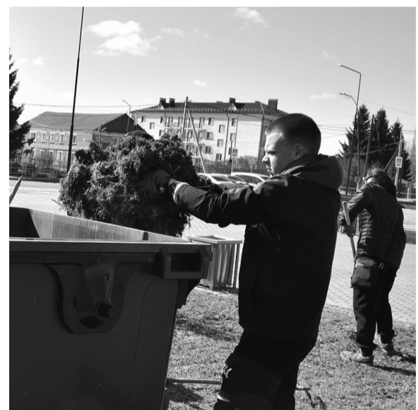
На снимках: Субботник у обелиска: каждый занят своим делом.

16 апреля, за несколько дней до Всероссийского дня заботы о памятниках истории и культуры, у обелиска воинам-землякам, погасшим в годы Великой Отечественной войны, собрались неравнодушные люди.