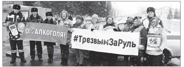
Совместное мероприятие провели сотрудники ГИБДД и волонтеры Центра «Лидер»