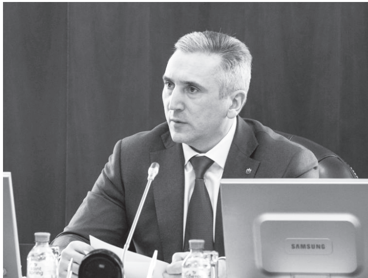
Губернатор области Александр Моор в прямом эфире рассказал о профилактике коронавируса в регионе

Рекомендации по проведению дополнительных мер профилактики даны также владельцам торговых центров, общественного