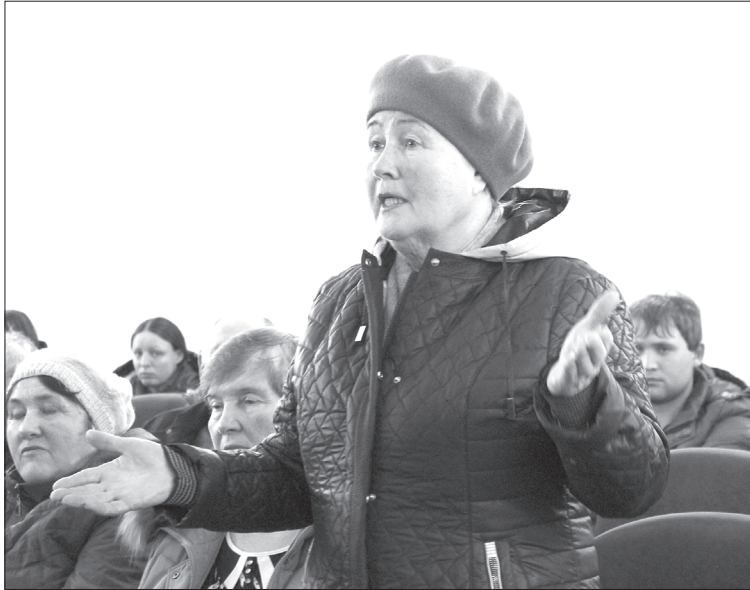
Важная часть схода – вопросы из зала