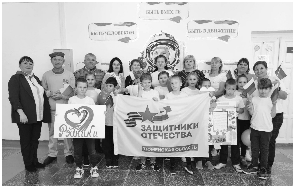
События этого дня запомнились и ученикам, и педагогам школы

В этот день в школе все присутствующие стали участни-