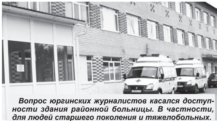
Вопрос юргинских журналистов касался доступности здания районной больницы. В частности, для людей старшего поколения и тяжелобольных.

Татьяна ГЕОГЕНОВА