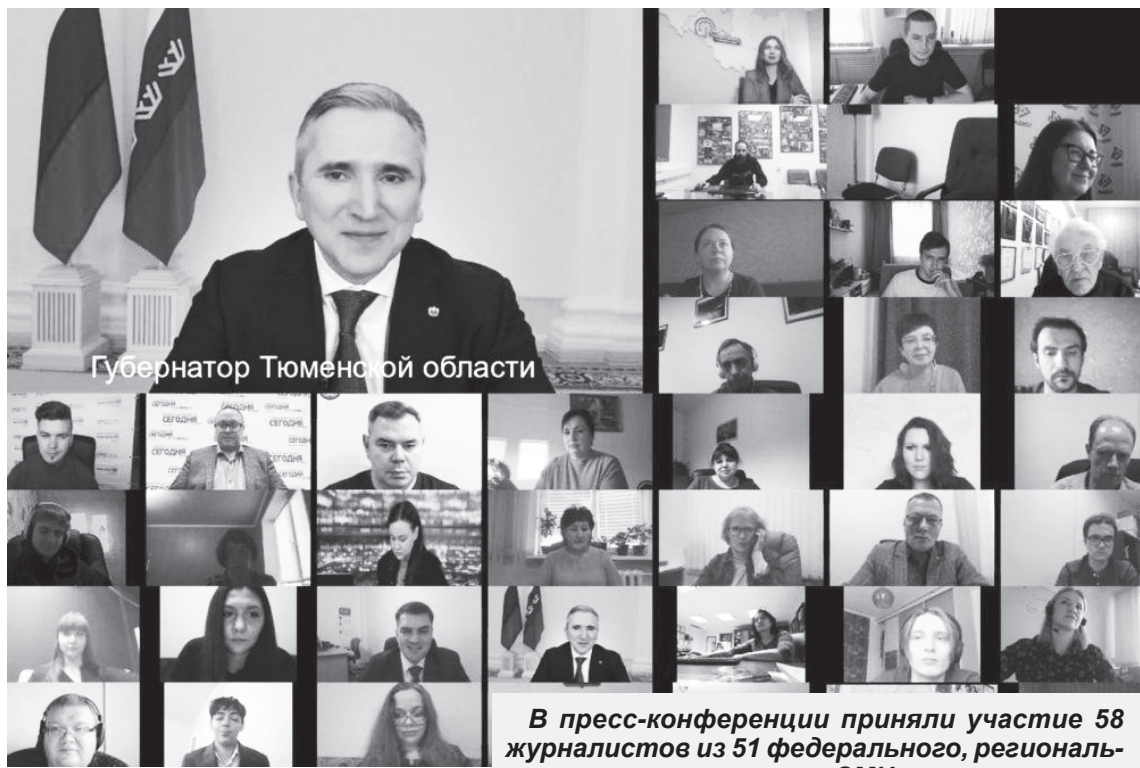
В пресс-конференции приняли участие 58 журналистов из 51 федерального, регионального и муниципального СМИ.