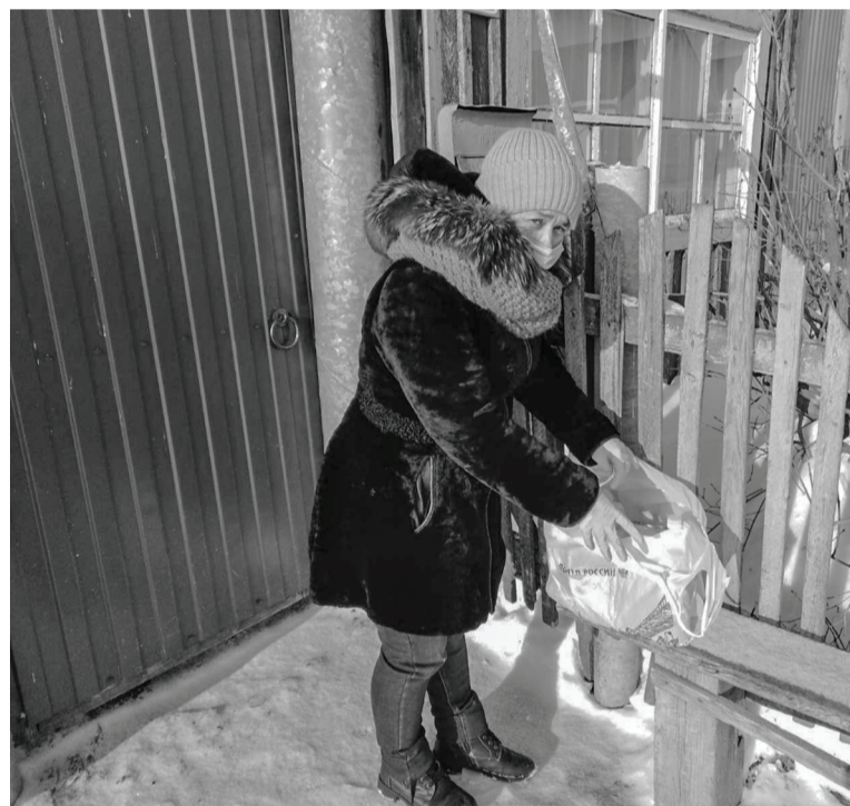
Волонтерский штаб действует с 2020 года. Сладковские добровольцы всегда готовы оказать помощь землякам.