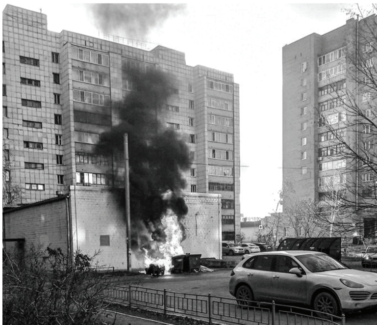
Безответственность жителей региона порой становится причиной печальных последствий.

Пресс-служба Тюменского экологического объединения