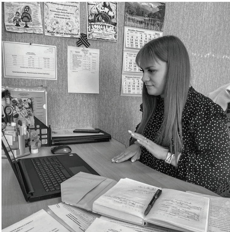
Сотрудники ДК проводят дистанционные занятия.

Для организации мероприятий в онлайн-режиме нужна тесная работа с коллективами. Поэтому все взаимодействия руководителей со своими подопечными проходят через бесплатные сервисы (вiber, ватсап и др.). А если говорить точнее, то руководитель пользуется теми средствами дистанционной работы, которые ему удобны по специфике его направления.