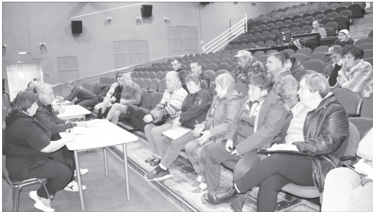
■ На встрече погорельцев с руководством района и социальными службами.

Как решаются проблемы пострадавших от огня