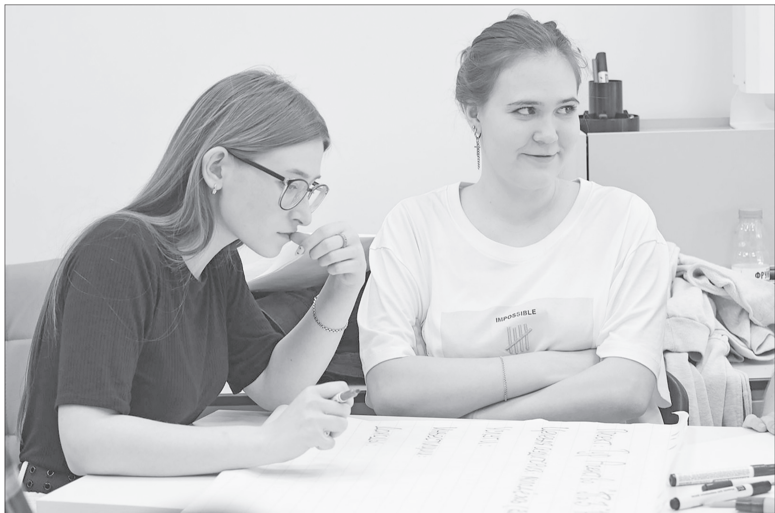
Летнее трудоустройство – прекрасный инструмент для социализации и обретения подростком полезных компетенций.

вого вознаграждения происходит следующим образом: работодатель выплачивает заработную плату, она не может быть меньше МРОТ. К этой цифре прибавляется районный коэффициент 15%. Центр занятости выплачивает материальную поддержку. В месяц она составляет 1725 рублей, но исходя из того, что подростки работают в среднем примерно 10 дней в месяц, они получают около 800 рублей. Всё зависит от количества рабочих дней по производственному календарю. Когда ребёнок отработает, работодатель выплачивает ему заработную плату, затем предоставляет нам табель, и мы выплачиваем ребёнку материальную поддержку на реквизиты счёта, указанные в его заявлении.