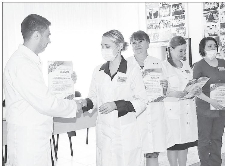
Благодарственные письма от администрации Областной больницы № 15 получили медицинские сестры всех отделений.

И только в свой профессиональный праздник те, кто не на дежурстве, смогли расслабиться и получить удо-