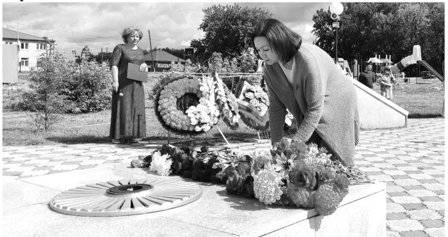
Представители предприятий и организаций района в этот день принесли цветы к мемориалу