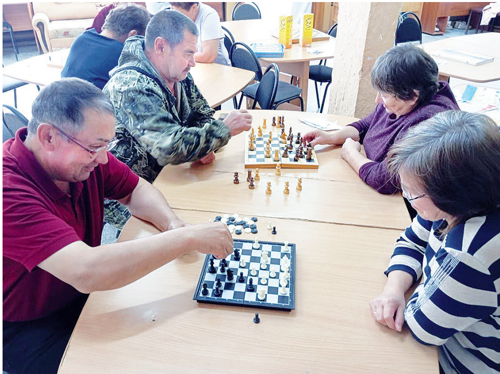
► Немало поклонников шахматного спорта в Санниковском поселении

» Форум станет дискуссионной площадкой для поиска ответов на критические вопросы: чем мышление предпринимателя отличается от мышления инвестора или менеджера, какие компетенции требуются для успешного бизнеса и почему непрерывное образование – важный критерий конкурентоспособности