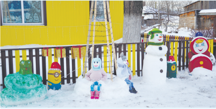
Семья Шарановых из с. Упорово ежегодно празднично оформляет придомовую территорию.