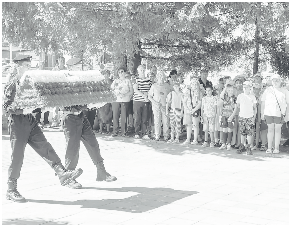
Уповорские курсанты чеканят шаг под звуки метронома.