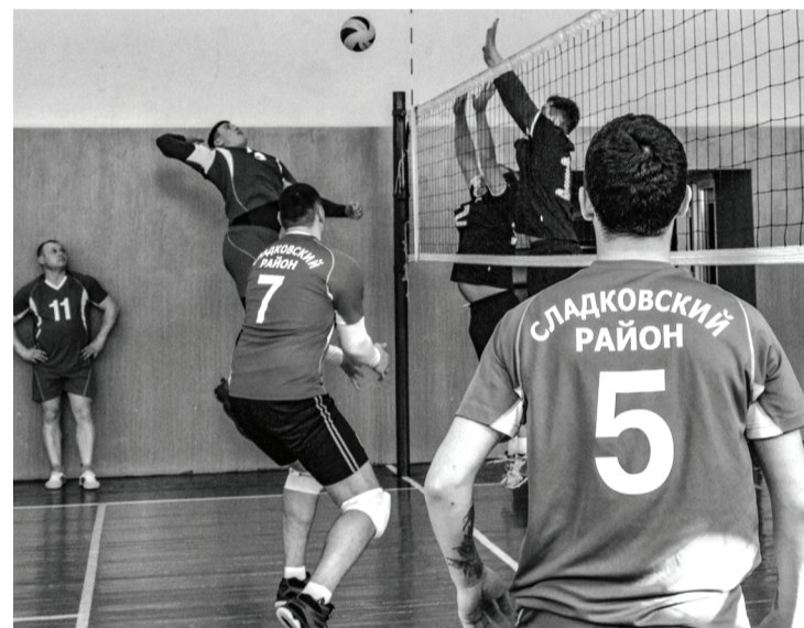
Спортсмены района сразились с соперниками. // Фото ДЮСШ «Темп»