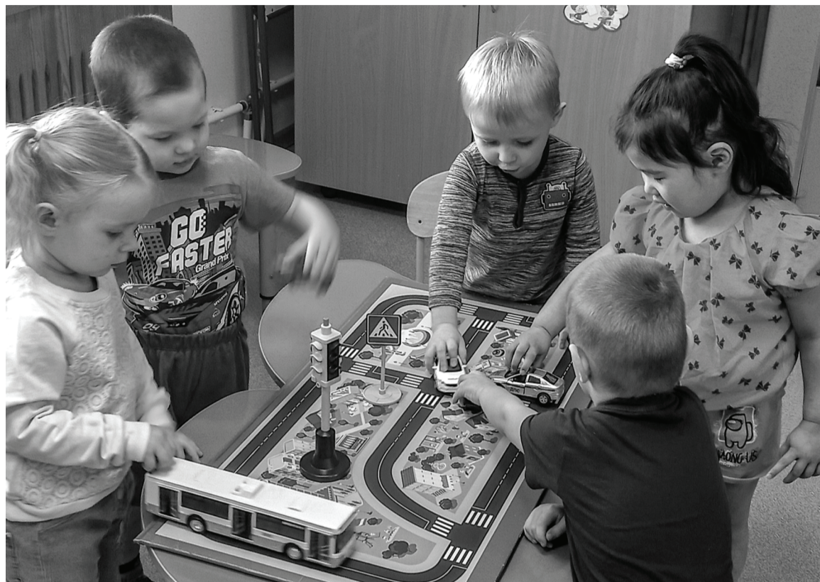
Малыши узнали о правилах безопасного поведения.

Воспитанники Сладковского детского сада «Сказка» приняли участие во Всероссийском открытом уроке «Основы безопасности жизнедеятельности»