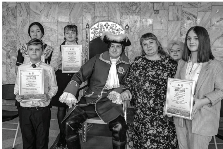
Лауреаты конкурса получили награды из рук Петра I.

Она поблагодарила всех за участие, смелость, патриотизм, гражданскую позицию и любовь к Родине, а педагогов – за профессионализм в подготовке конкурсантов. Все лауреаты получили дипломы и памятные сувениры из рук «виновника торжества»