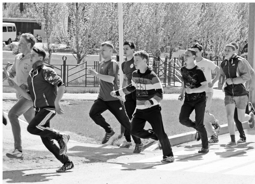
Старт эстафеты дан.

После традиционных приветствий и пожеланий, возложения венков к монументу «Алёша» был дан старт эстафете воспитанников дошкольных