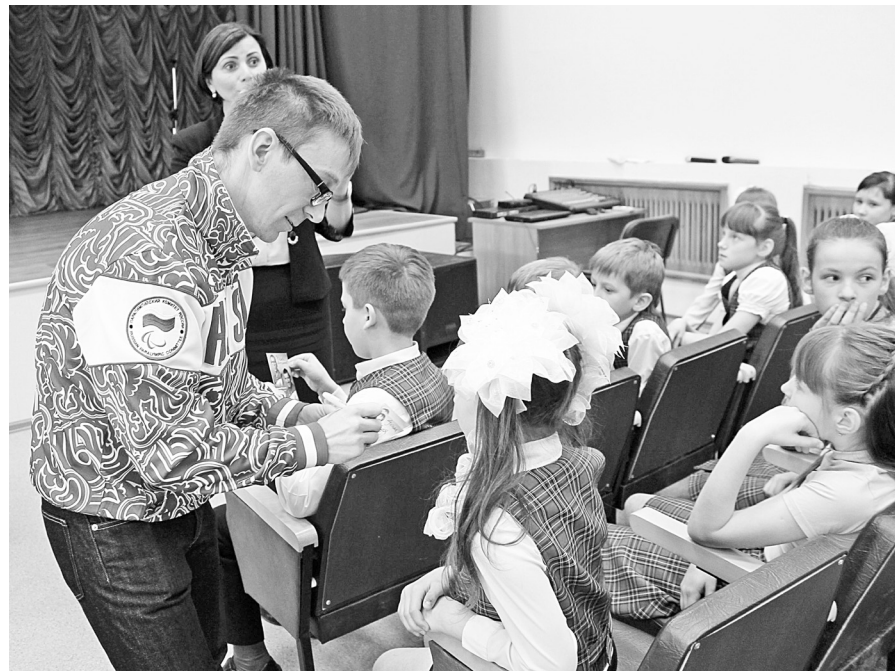
Автограф от знаменитого гостя.

После перемены состоялся урок-тренировка олимпийца со старшими школьниками. Было заметно, что даже предварительный разогрев кое-