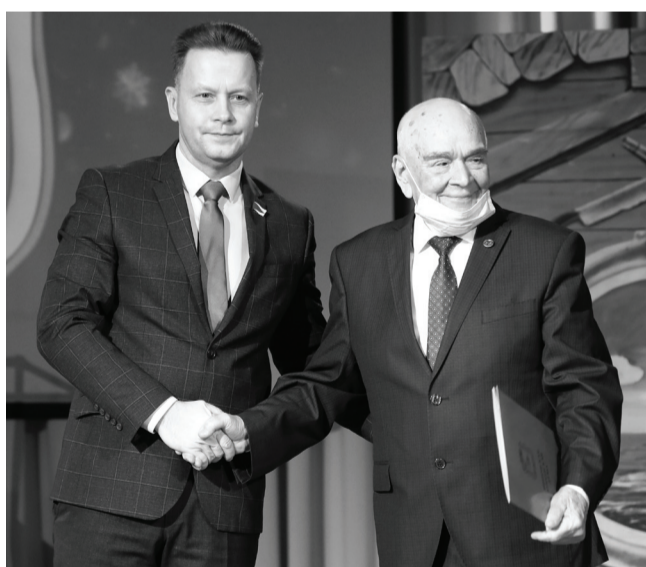
Стать заботливыми бабушками не только своим внукам готовы активисты из городского совета ветеранов. Благодаря их мудрости, чуткости и вниманию растет количество счастливых семей в Ишиме.

– Хорошо организована работа в рамках «Диалога поколений» ветеранскими организациями школ №№ 4, 5, 8, 12, 31 и в ТОСах «Центральный», «Восточный», «Первомайский» и других. Для детей организуют досуг, проводят спортивные соревнования – любят ребята шашки и шахматы, волейбол и баскетбол. Ветераны многопрофильного техникума помогают детям в учебе – индивидуально занимаются по математике, физике, окружающему миру. Большую работу проводят участники «Диалога поколений» по оказанию помощи в быту мамам, которые на время