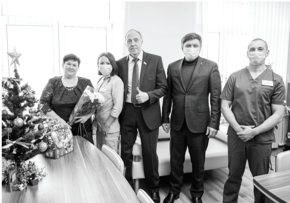
Второй год медработники находятся в авангарде борьбы с коронавирусом. Поэтому в преддверии Нового года Виктор Рейн сделал акцент на встречах с представителями медицинского сообщества, чтобы поддержать их и подарить праздник.

Не менее добротный бюджет принят и на следующий год. Доходная часть запланирована в сумме 195 млрд рублей, расходная – 233 млрд рублей, причем более 50 % от нее – на социальную политику. Предприняты меры по поддержке реального сектора экономики, АПК. «Бюджет рассчитывался по двум сценариям – консервативному и базовому, но оба они зависят от самочувствия нефтегазовой отрасли – налог от прибыли предприятий данного комплекса формирует 63 % областной казны.