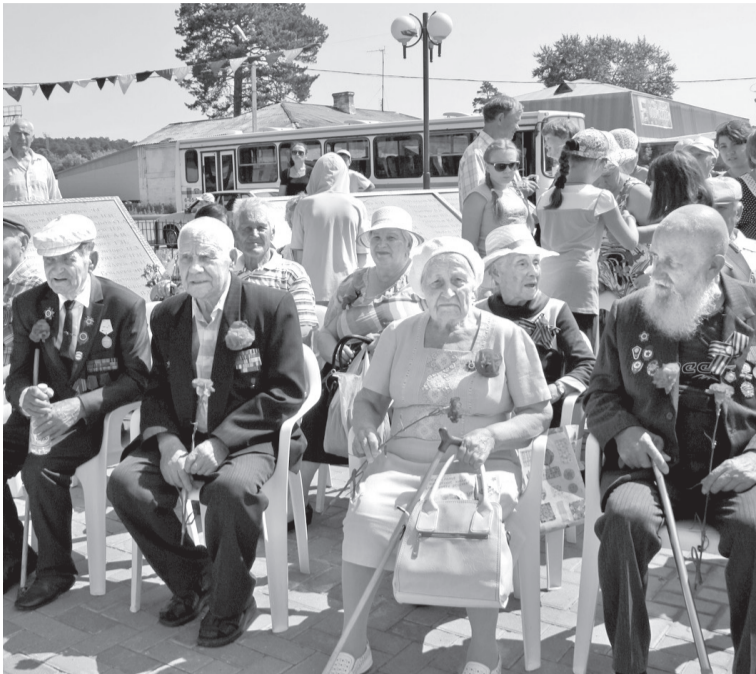
• В знак благодарности ветеранам-фронтовикам – алые гвоздики.

День, навсегда изменивший жизни миллионов людей, день памяти о тех, кто не вернулся с войны... Вчера в стране отметили 74-ю годовщину начала Великой Отечественной войны.