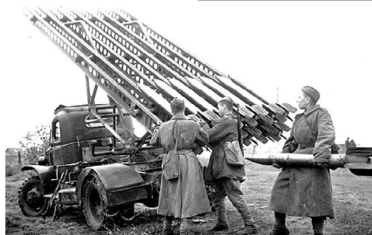
В Смоленском сражении применили новое оружие - реактивные установки - знаменитые «Катюши». 14 июля 1941 года прогремел первый в истории войн залп ракетного оружия, легендарной «Катюши». Это был огненный смерч, который сжигал все

Городам Ельня, Великие Луки за мужество, стойкость и героизм присвоено почетное звание «Город воинской славы» 9 мая 2006 года.