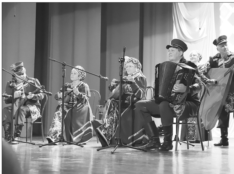
Ансамбль русских народных инструментов «Росинка» представил на суд жюри композицию «Калинка»