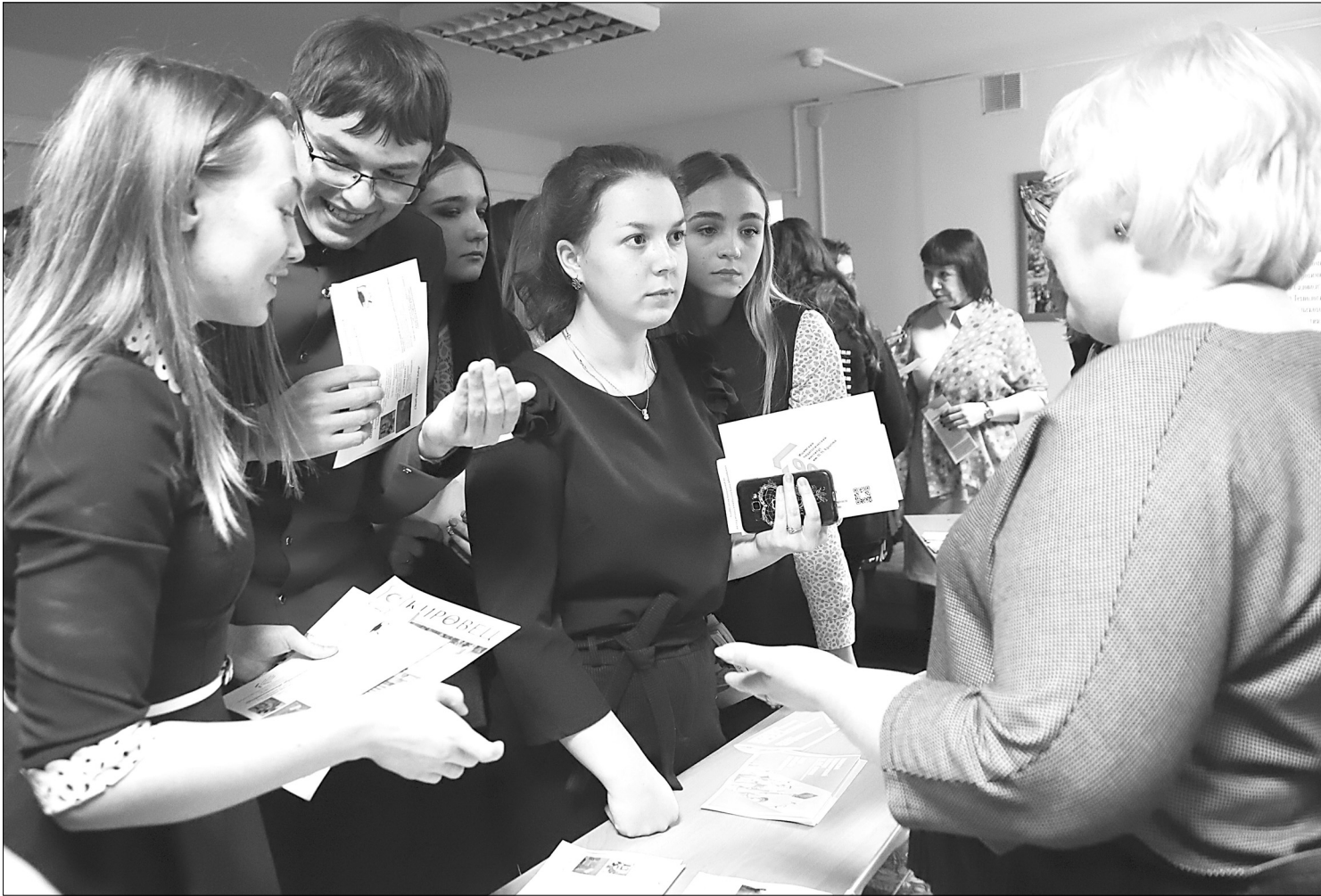
Возле информационных столов в фойе администрации округа старшеклассники активно обращались к представителям учебных заведений за индивидуальными консультациями