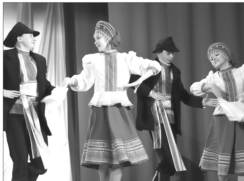
Образцовый любительский коллектив «Ансамбль народного танца «Карасуль» в Голышманово привёз новые танцевальные постановки