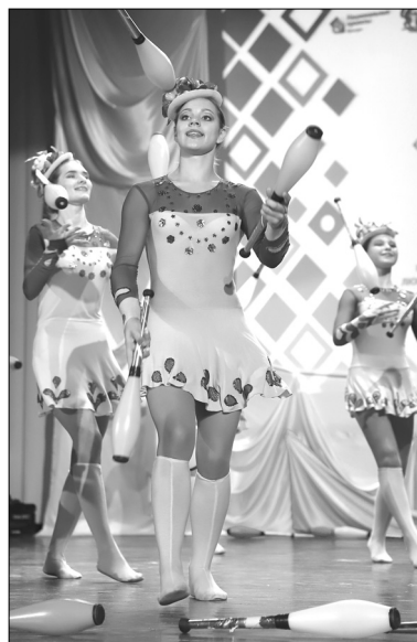
У каждого жонглёра цирковой студии «Мечта» по 5 булав и 6 мячей