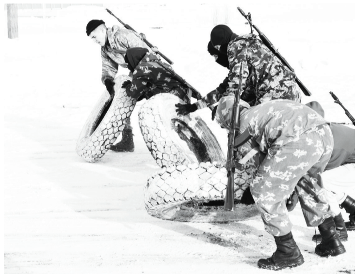
Перетаскивание колёс требовало от участников дружной работы в команде.