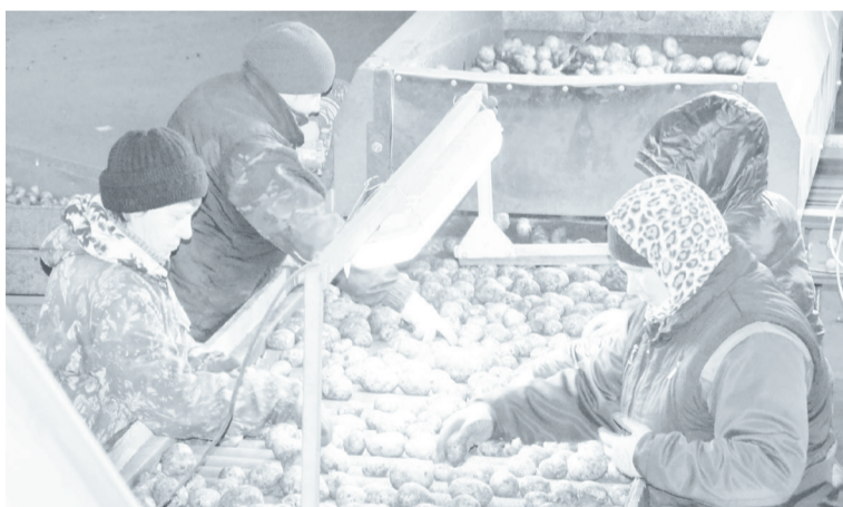
Работники овощехранилища у сортировочного стола.

Сейчас на формировании партии для отгрузки трудится коллектив из семи человек. С работой на сортировочном столе справляются четыре женщины, которые отработанными до автоматизма движениями удаляют с транспортёрной ленты овощи с