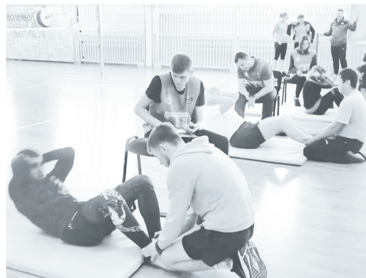
На районном фестивале отбирают спортсменов для участия на соревнованиях областного уровня.