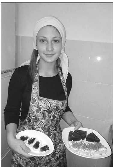
«Чёрную икру» юные повара готовят на основе соевого соуса, а «красную» – из ягодного сиропа. Используют для оформления бутербродов и фаршированных яиц

В Голышмановском агропедколледже продолжают обучать школьников различным профессиям.