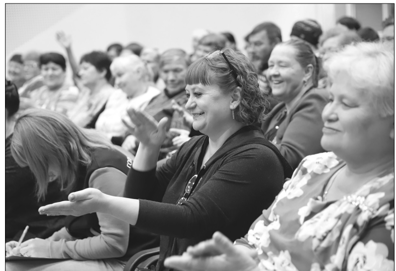
Люди с ограниченными возможностями здоровья с энтузиазмом учились аплодировать разными способами