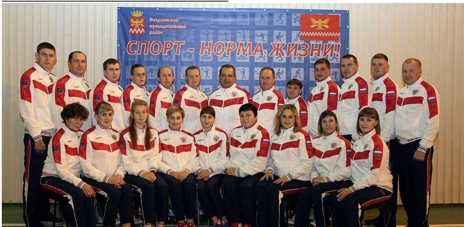
Сборная Викуловского района