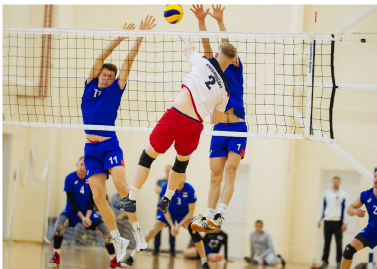
Момент игры

Соревнования проводились по не совсем обычной системе: по ходу состязаний встречались команды из разных групп, но баллы за встречи шли в общий