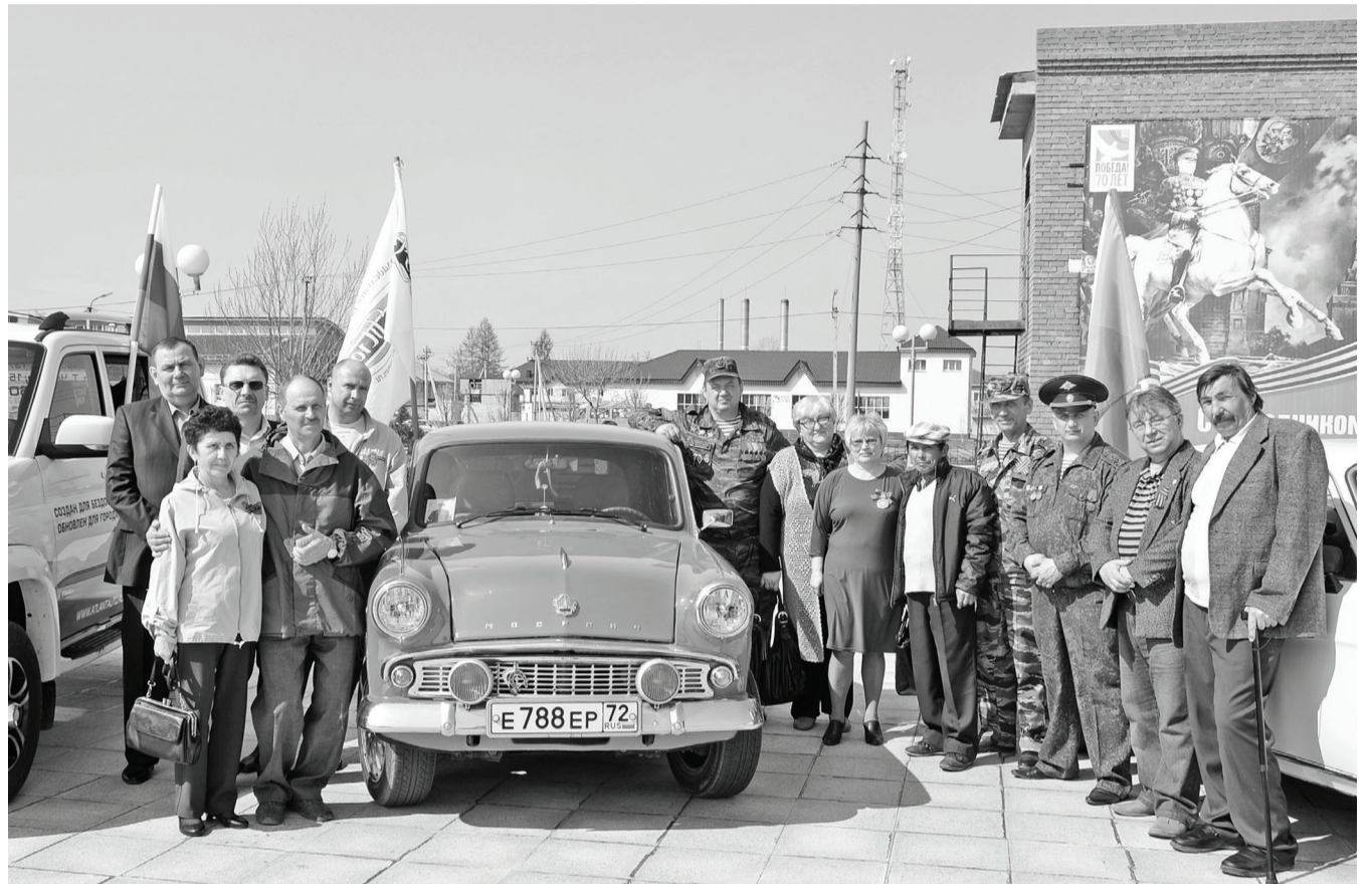
Фото на память.

Площадь Победы 30 апреля собрала ветеранов, школьников, малышей – всех желающих. Яркие шары, флажки с юбилейной символикой на фоне серого и белого камня выглядели настоящим фейерверком!