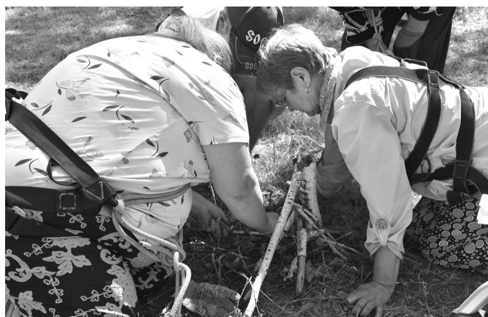
На снимках: фрагменты "Робинзоады-2022"