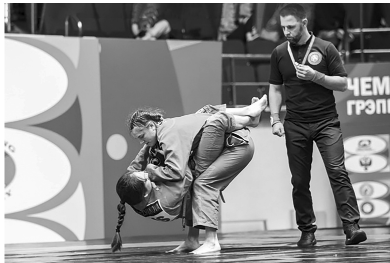
Один из зрелищных моментов поединка Василисы Бобровской на чемпионате России по грэпплингу в Санкт-Петербурге

Надежда ЧЕРЕПАНОВА Фото из личного архива