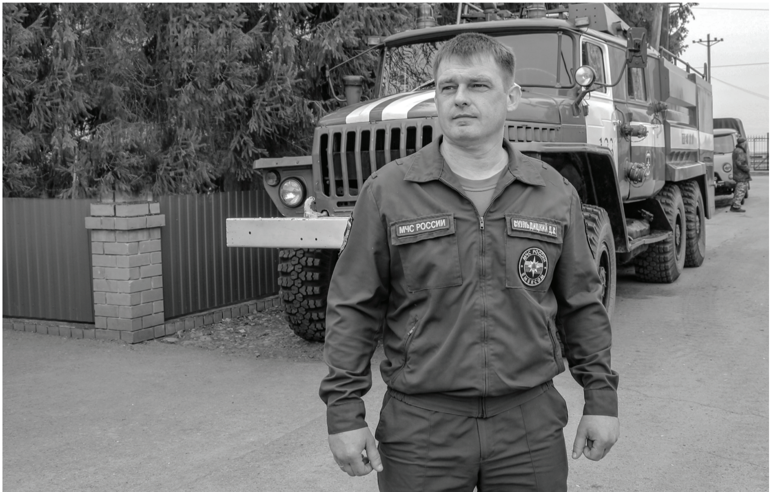
Профессию огнеборца наш земляк выбрал неслучайно.