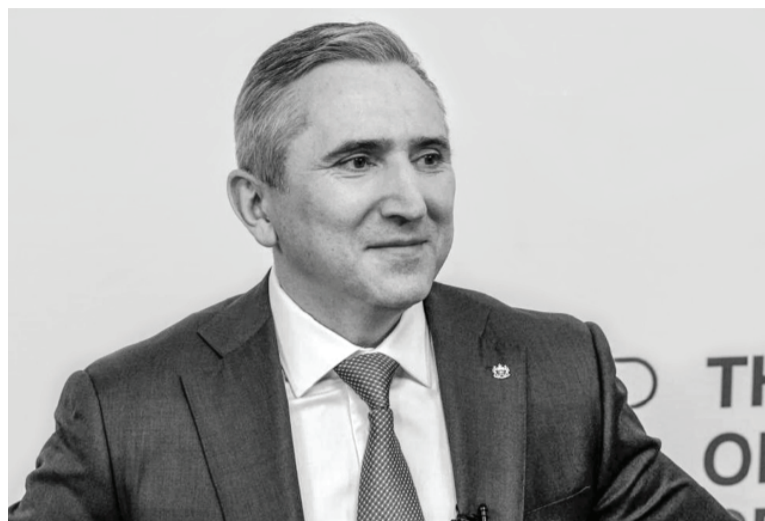
Александр Моор.

Губернатор Тюменской области провёл пресс-конференцию