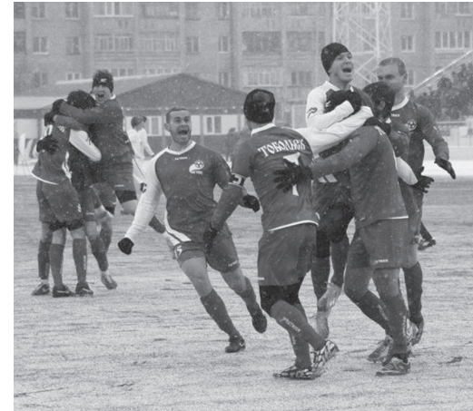
Дерби-2014. Победа на снегу