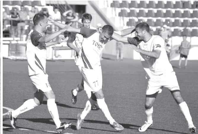
Дерби-2015. Победа под солнцем

хозяева вновь приступили к осадным действиям.