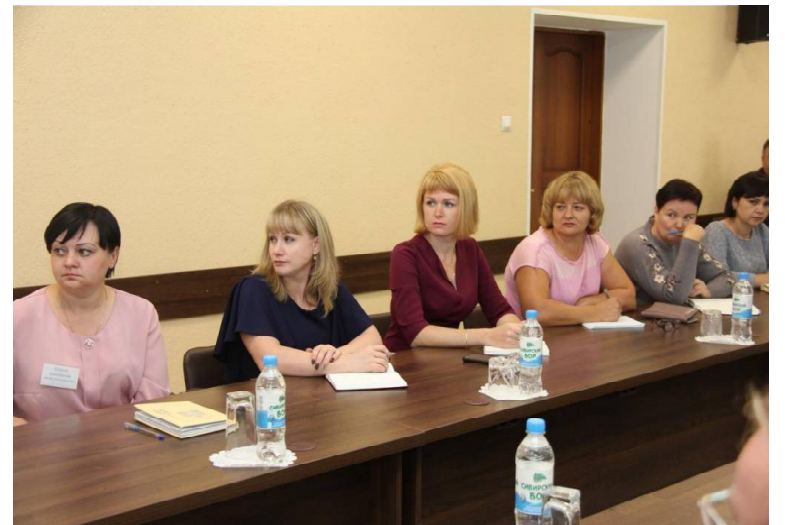
➤ Участники семинара Ишимской зоны