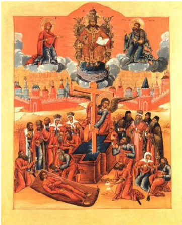
Икона Изнесения честных древ Животворящего Креста Господня.

Самый первый Спас неизменно отмечается 14 августа и совпадает с началом Успенского поста. Он известен как Изнесение честных древ Животворящего Креста Господня. Установили праздник в 9 веке в Константинополе. Каждый год часть Креста, который хранился в домово-церкви греческих императоров, приносили в храм Святой Софии и освящали воду для исцеления болезней. Первый день августа (по старому стилю) выбрали потому, что в этом жарком месяце особенно распространялись болезни. Люди же прикладывались ко Кресту, на котором был распят Христос, пили освящённую воду и получали долгожданное здоровье. Отсюда праздник называют ещё и Спасом «на воде».