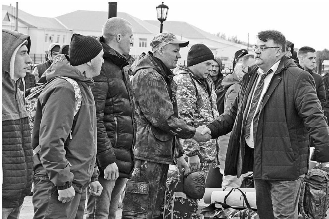
› В пункте сбора граждан, 7 октября