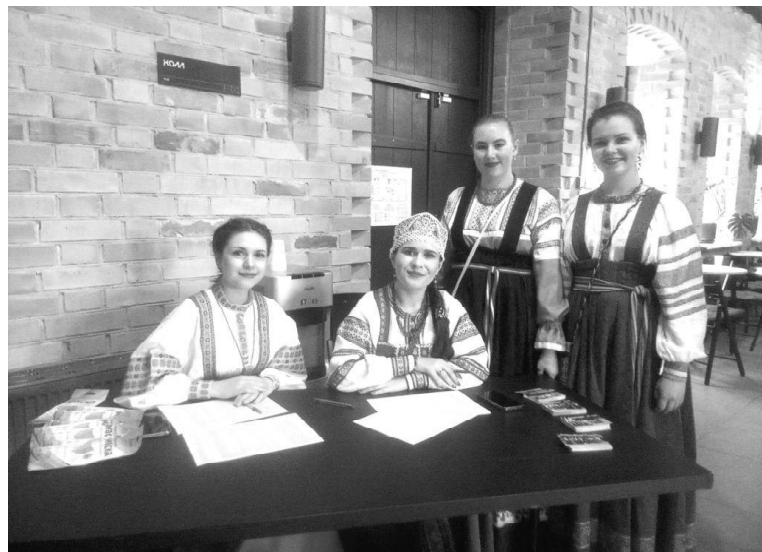
➤ Идёт регистрация участников