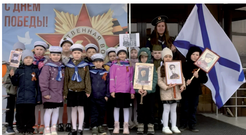
Взвод «Юные моряки».