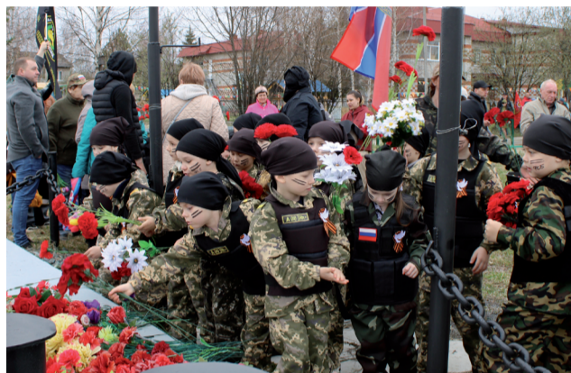
Торжественное возложение цветов.