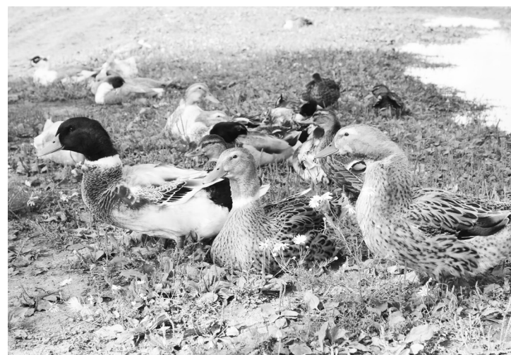
Утиная семья пригласилась на осеннем солнышке посреди хозяйского двора.