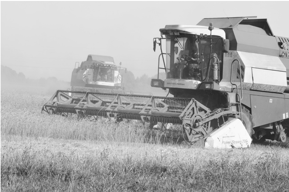
Всё-таки мы успели на конец жатвы. На последнем участке в хозяйстве Виктора Шабалина комбайны работают вкруговую, и пшеничное поле тает на глазах.

Но это не весь секрет. Виктор Шабалин вкладывается в развитие хозяйства, регулярно обновляя парк техники. У него мощные трактора, относительно новые комбайны – это, конечно, являет-