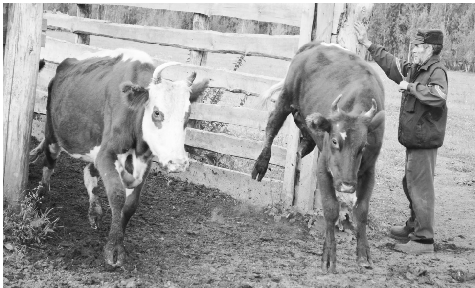
«Эх, раззудитесь, рога, размахнитесь, копыта!» – похоже так можно охарактеризовать эмоции коров, которых выпустили на пастбище.