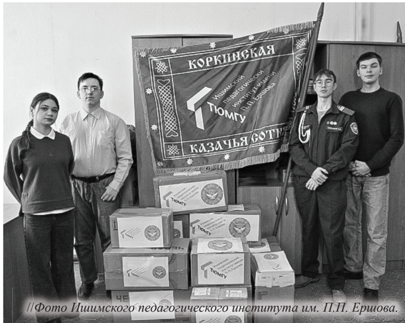
//Фото Ишимского педагогического института им. П.П. Ершова.