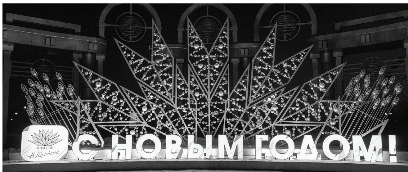
Агрохолдинг «Юбилейный» желает землякам счастливого Нового 2026 года и Рождества!

Проект стартовал с глубокого обновления учебного процесса. Специалисты практики из «Юбилейного» совместно с преподавателями вуза полностью актуализировали программы ключевых дисциплин: «Земледелие», «Растениеводство», «Агрохимия», «Защита растений и применение химических средств», «Кормление животных с основами