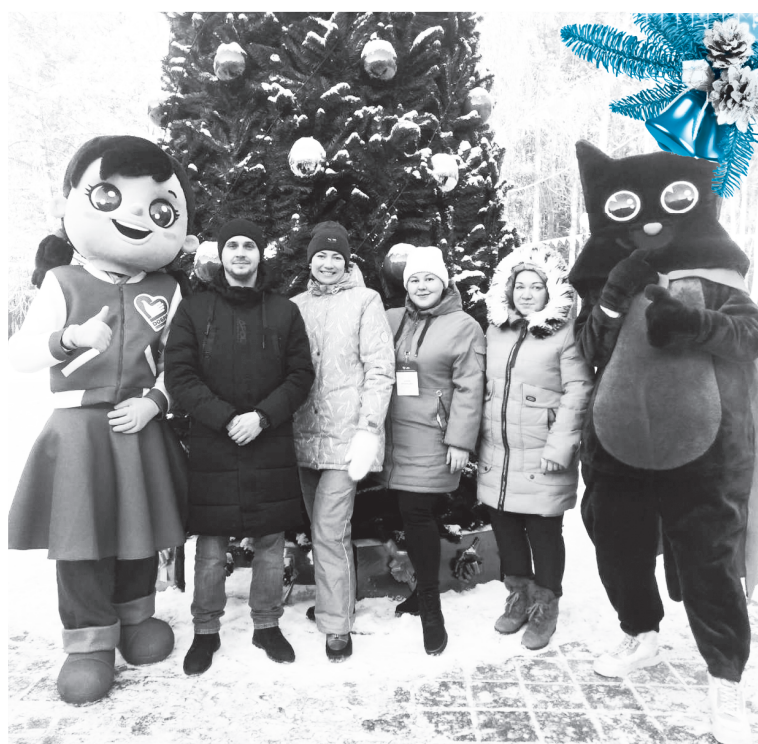
Юргинская делегация добровольцев в «Ребячьей республике»

– Под руководством опытных экспертов мы изучали эффективные практики, способы работы с информацией и другие лайфхаки успешной работы. Всё было круто – от первого и до последнего