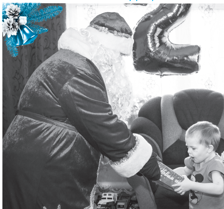
Получить подарок из рук Деда Мороза – это круто!

СОСТОЯЛОСЬ ТРАДИЦИОННОЕ ВРУЧЕНИЕ ПОДАРКОВ ОТ ГУБЕРНАТОРА