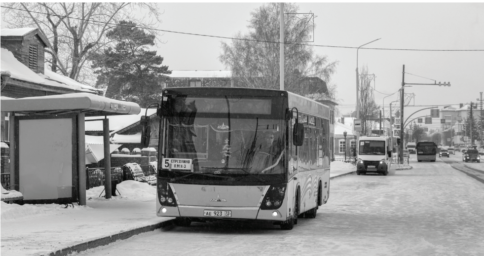
Ишимское ПАТП стремится к переводу платежей за проезд на безналичный расчет. Градация тарифов направлена на достижение этой же цели.

– Мы долго сдерживали рост цен, искали внутренние резервы, оптимизировали расходы, но возможности исчерпаны. Цены на топливо, запчасти, техническое обслуживание и коммунальные услуги растут стремительно, тогда как тарифы на проезд оставались практически неизменными. Инфляция и экономические реалии 2024–2025 годов оказали колоссальное давление на нашу деятельность. Они напрямую сказываются на заработной плате водителей и кондукторов, нехватке кадров, обновлении подвижного состава. Поэтому мы были вынуждены принять непростое, но необходимое решение – скорректировать тариф на проезд, – прокомментировал генеральный директор АО «Ишимское ПАТП» Евгений Павлюченко. – И это не стремление к прибыли, а попытка сохранить предприятие, которое