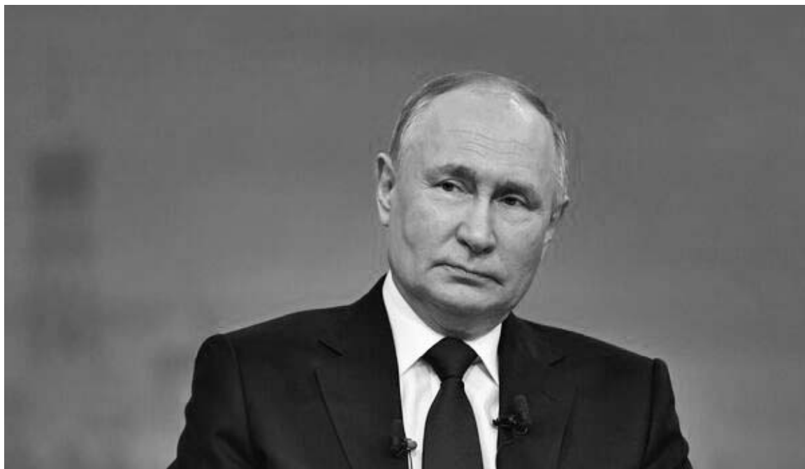
➤ Президент Российской Федерации Владимир Путин

14 декабря состоялась прямая линия и пресс-конференция президента Российской Федерации Владимира Путина. На неё поступило более 1,5 млн вопросов. Они касались развития здравоохранения, образования, спорта, соцподдержки, внутренней и внешней политики страны и других тем. Задать вопрос президенту мог любой желающий на сайте «Итоги года с Владимиром Путиным», по тел. 8-800-200-40-40, по смс, в соцсетях «ВКонтакте» и «Одноклассники».