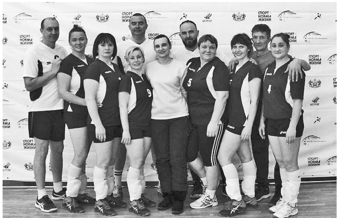
➤ Представители ветеранов викуловского волейбола в Тобольске

Ольга НИКОЛАЕВА по материалам ДЮСШ «Спринт»