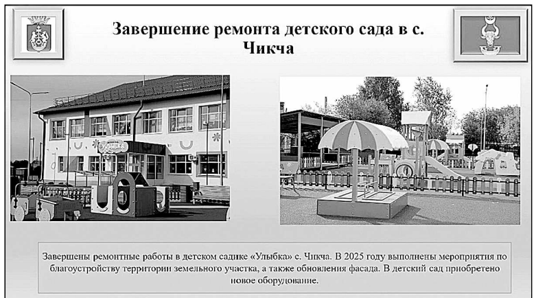
Завершение ремонта детского сада в с. Чикча