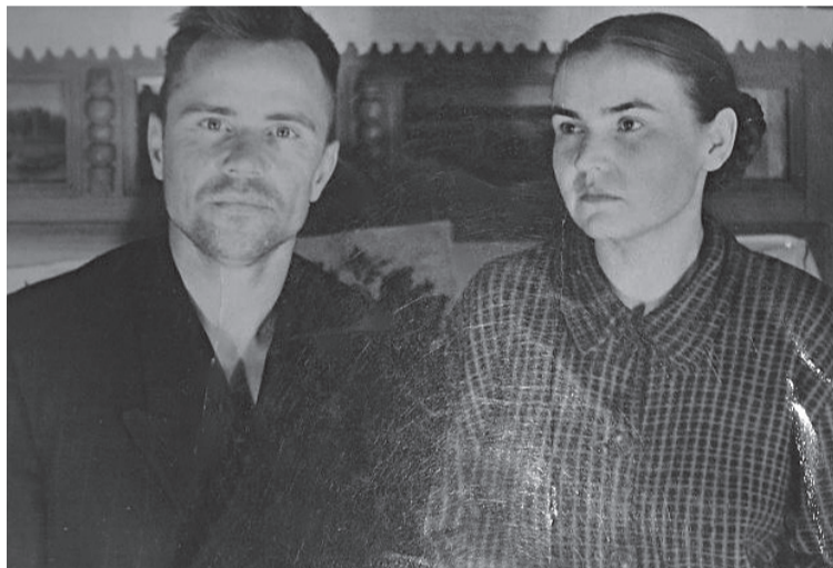
Папа и мама в молодые годы.