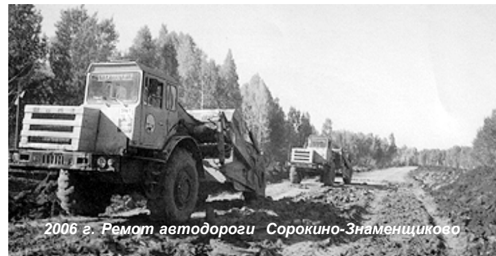
2006 г. Ремонт автодороги Сорокино-Знаменщигово