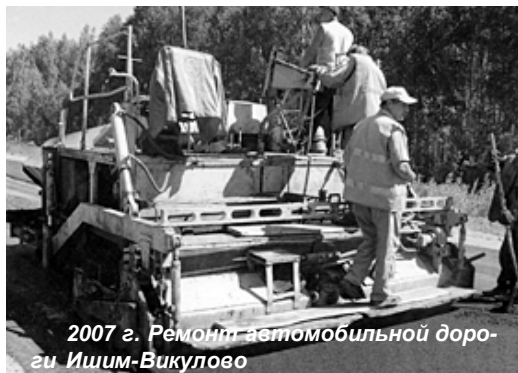
2007 г. Ремонт автомобильной дороги Ишим-Викулово

Людмила ДЮРЯГИНА. Историческую справку по предприятию подготовила ведущий специалист С.В. Кошелева.