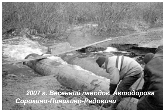
2007 г. Весенний паводок. Автодорога Сорокино-Пинигино-Рядовичи