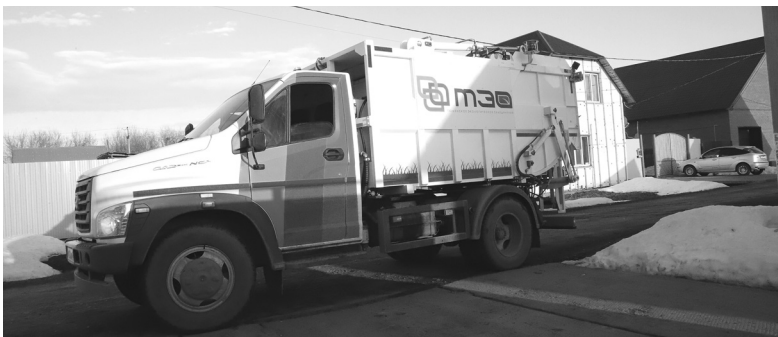
На такой новой технике рабочие ООО «Сибсервис» собирают мусор из евроконтейнеров

В Голышмановском округе сменился возчик мусора