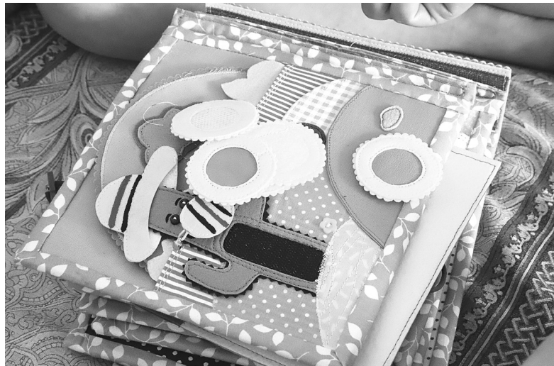
Развивающие книги от Екатерины Волковой пользуются спросом

Наталья ГЛАДКОВСКАЯ