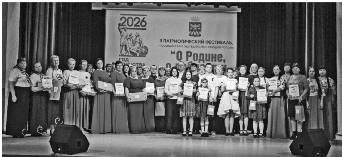
» Участники фестиваля