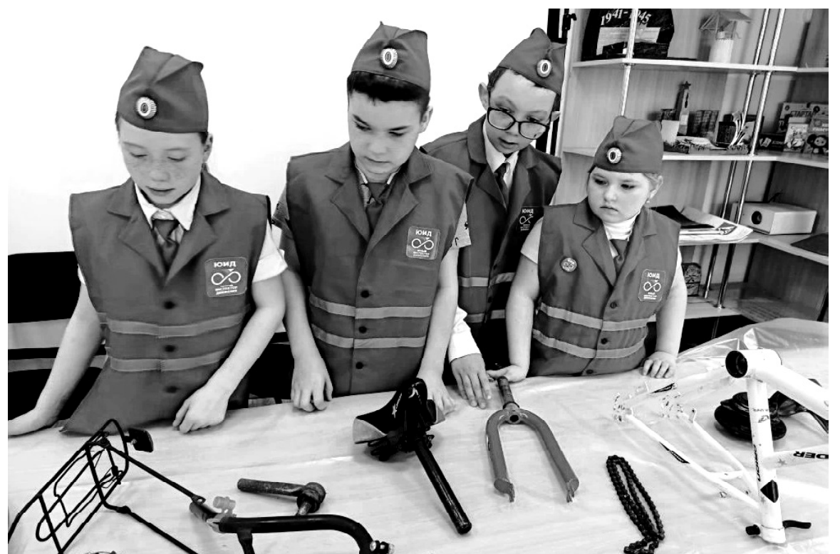
➤ Фото из архива Викуловского Центра творчества