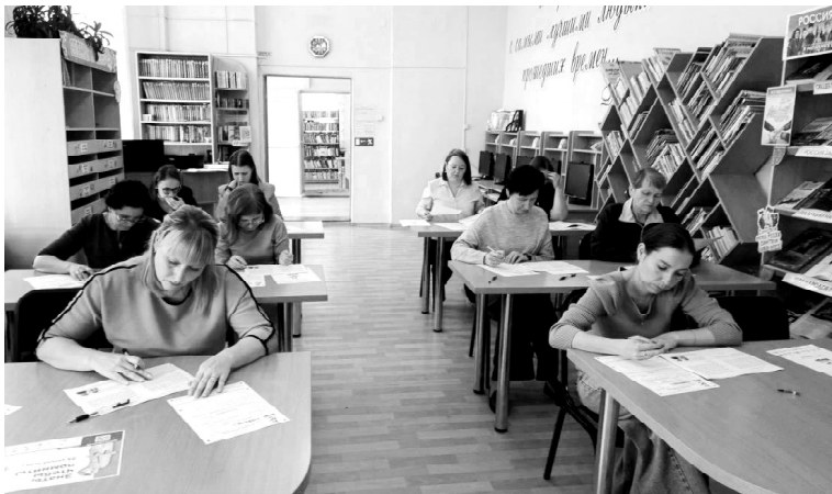
➤ В библиотеке пишут «Диктант Победы»

«Диктант Победы» — это международная историко-патриотическая акция, посвящённая событиям Великой Отечественной войны. Она направлена на проверку знаний о ключевых событиях, героях и уроках войны. А также — на укрепление единства граждан России через уважение к историческим корням.