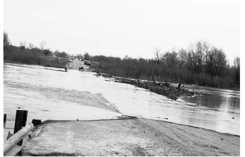
➤ На переправе в Балаганах

борку по необходимости, но не реже 2-х раз в неделю.