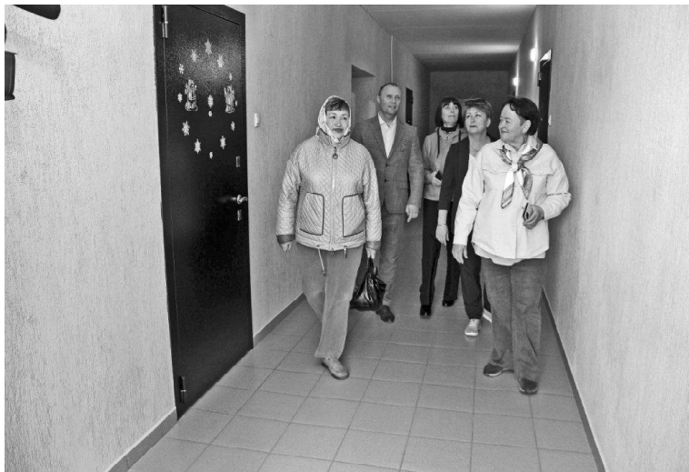
➤ Народная комиссия в новостройках

«В новые квартиры с хорошим настроением» — так называлась статья в нашей газете 2 декабря 2023 года. Ключи от своих квартир получили граждане, которые долгое время стояли на очереди. Это категория малоимущих жителей нашего района.