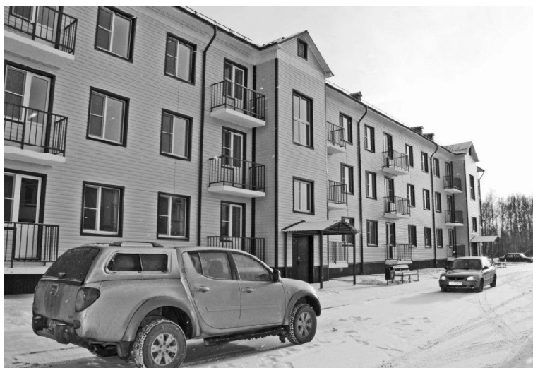
➤ Фото Татьяны Суховой и из её архива