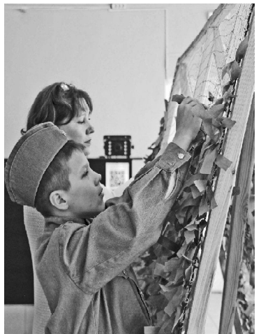
» В фойе РДК плетут сети