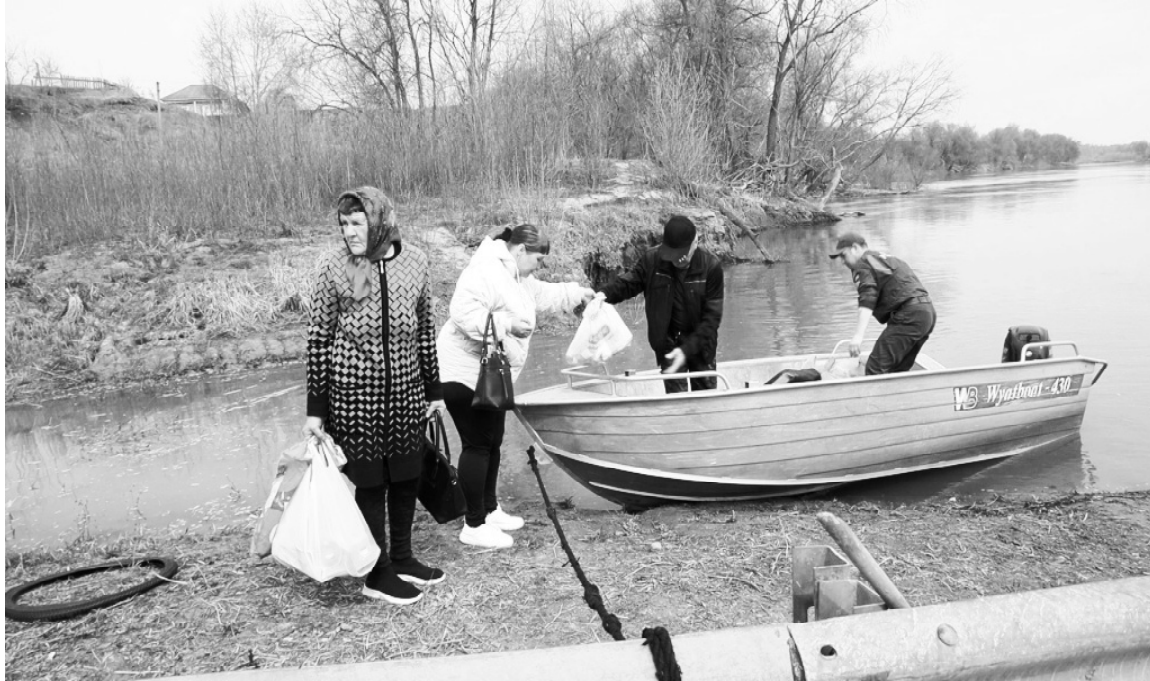
➤ Жители готовятся к переправе

На территории Заборки имеется магазин. Собственник магазина до 24 апреля завёз товары первой необходимости. Обновление товаров осуществляется два раза в неделю. Хлеб завозит производитель в магазин в За-