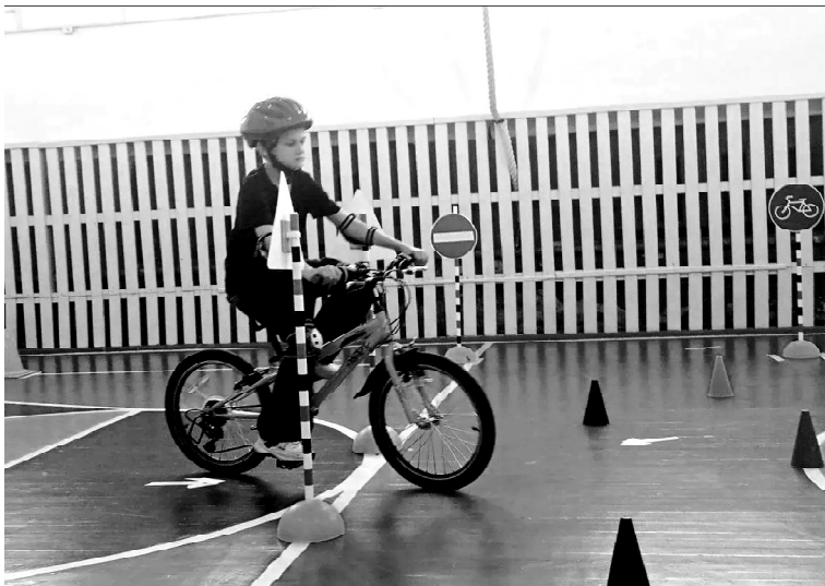
➤ На станциях «Безопасного колеса»