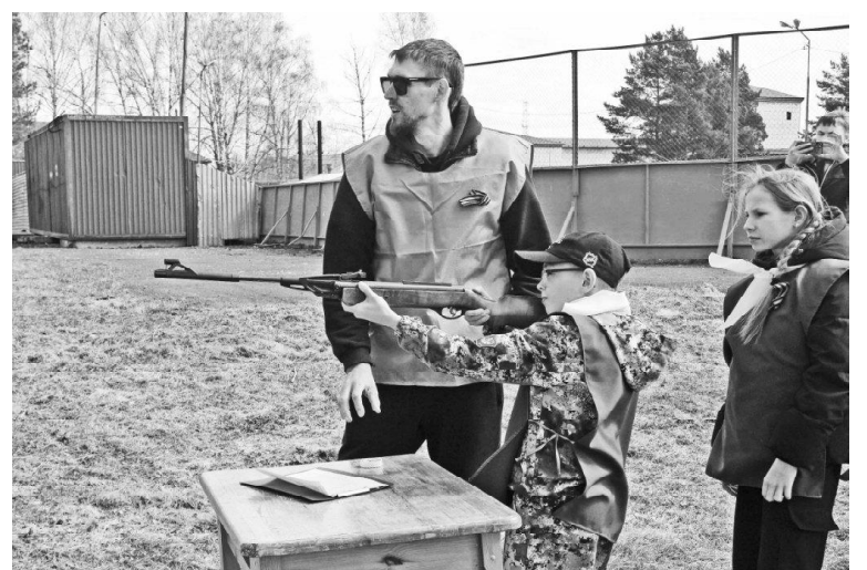
› Моменты «Военно-патриотической игры» «Зарница 2.0»