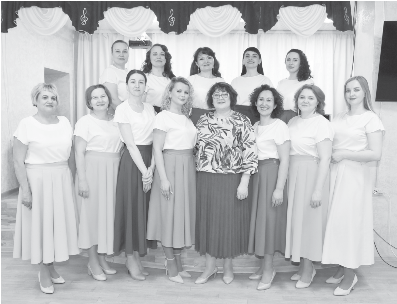
Вокальный ансамбль «Птица счастья»

8 марта – праздник весны, любви, посвящённый нашим дорогим женщинам. Сегодня прекрасная половина человечества достигает выдающихся результатов во всех сферах жизни. Но особенно ярко женщины проявляют себя в искусстве.