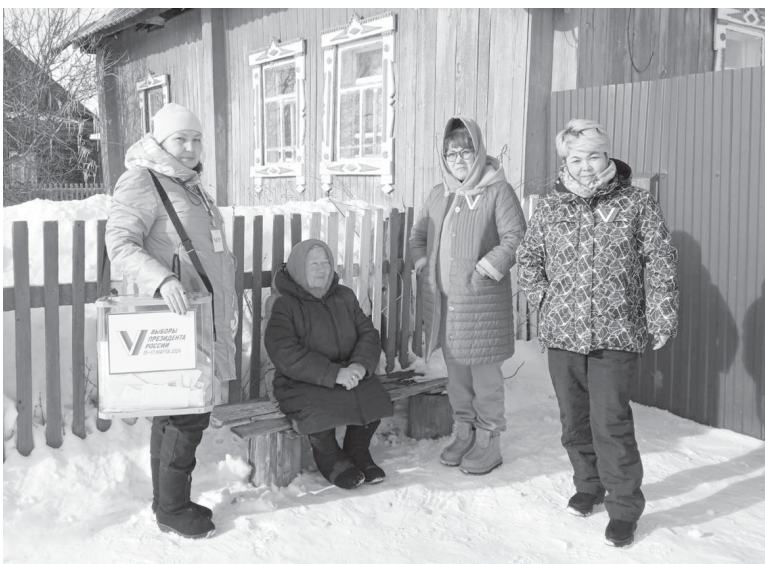
Досрочное голосование в селе Сеиты

Юрий ЗАЙЦЕВ, фото из архива Сорокинское с/п