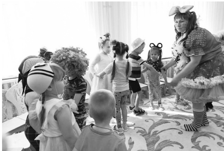
|| Фото из архива шороховского детского сада

Мероприятие завершилось танцем-игрой «За руки берись и весело кружись» и, конечно, сладким угощением детей. После таких забав домовый детского сада точно проснулся и настроение у него будет отличным целый год.