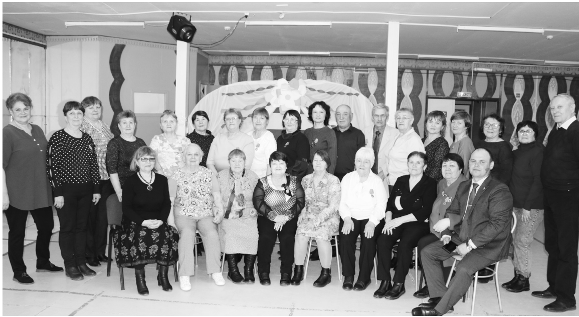
|| Фото автора

К кировчанам обратился начальник штаба Исетского отделения Всероссийской общественной организации ветера-