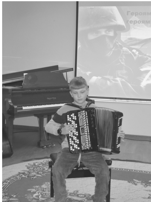
В зале не было свободных мест - собрались педагоги и воспитанники школы искусств. Ребята играли на фортепиано, баяне и читали стихи