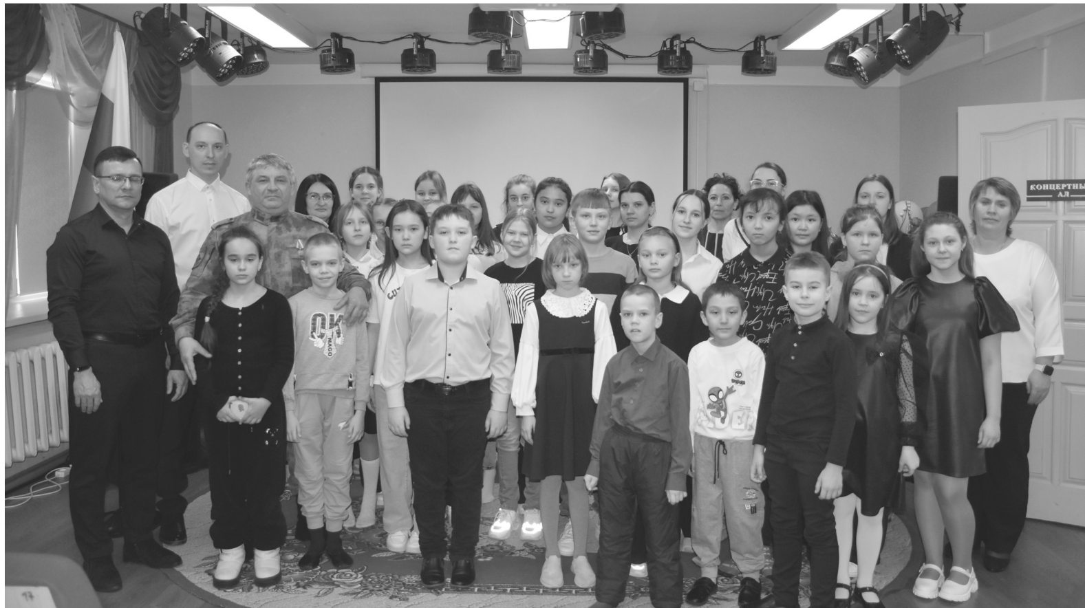
Ребята запомнили этот вечер, они долго к нему готовились и репетировали творческие номера

- Я знаю, что солдаты ждут наши письма. Так мы еще будем писать, пусть помнят, что