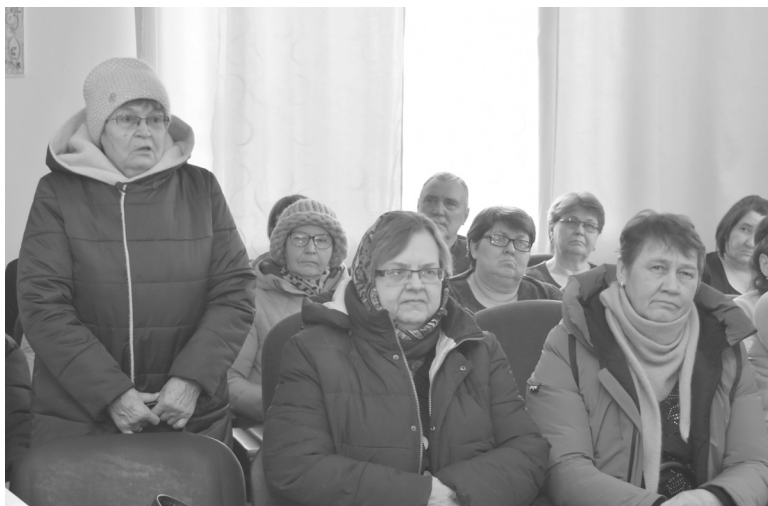
Жители активно участвовали в собрании, обозначили проблемы, которые их волнуют

Как и в любом другом поселении, в Старорямово есть свои проблемы и вопросы. Среди них – наведение и поддержание порядка и чистоты