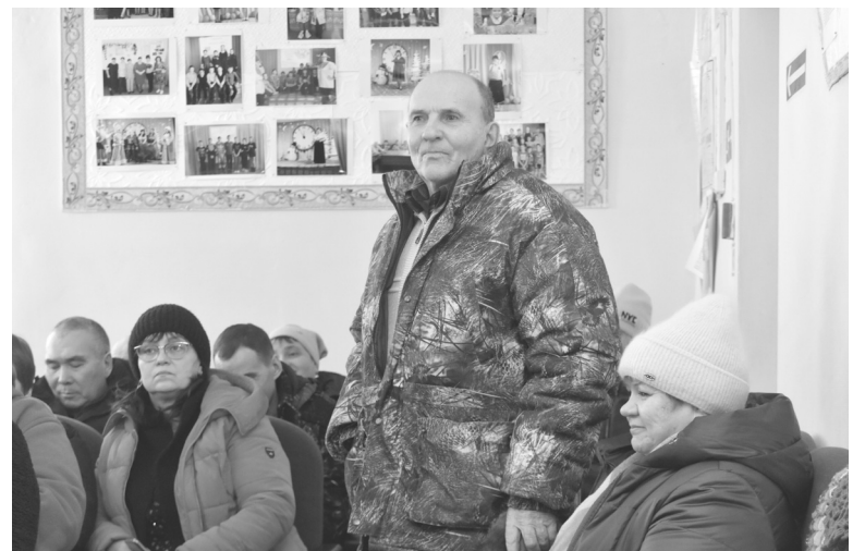
Рямовцы с вопросами обратились к Александру Хуснулину и его заместителям