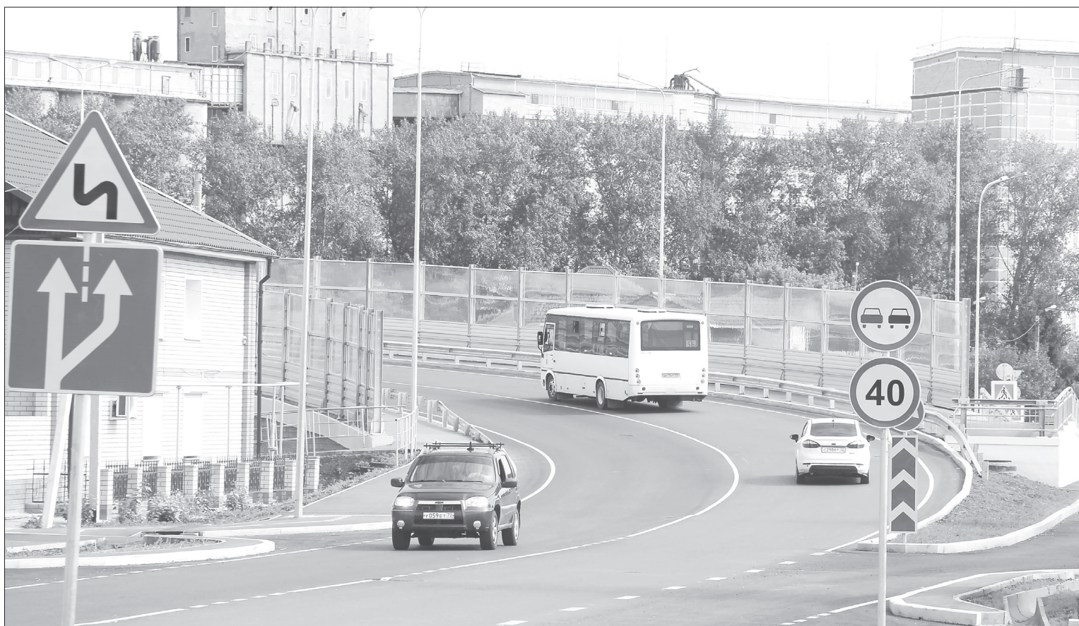
Горожане всё ещё привыкают к тому, что поездка из центра за линию теперь занимает считанные минуты

Автобусы 3К, 5Б и 10 идут по новой схеме движения