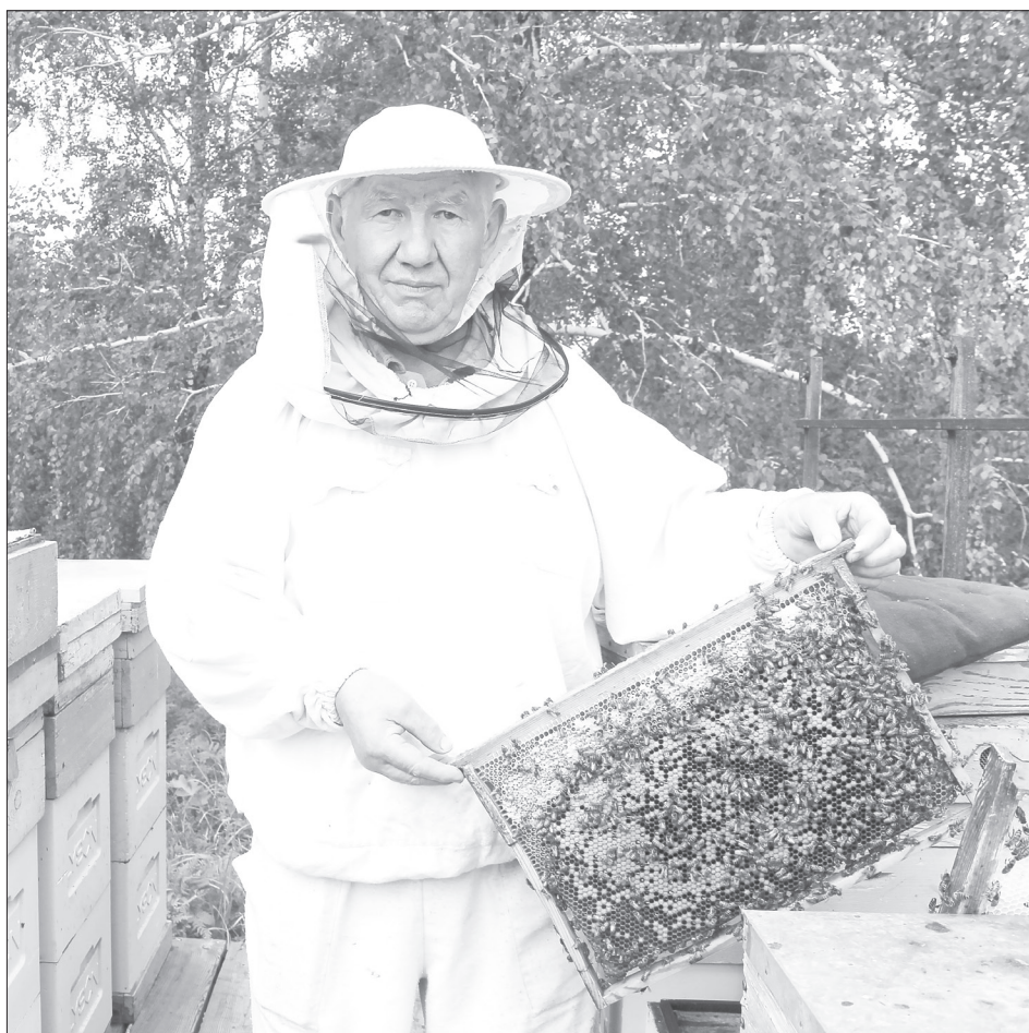
Сейчас пасечник держит пчёл миролюбивой породы, поэтому даже рядом с ульями можно ненадолго снять шляпу-накомарник

Чего только стоят ежегодные выезды, отслеживание химобработок полей (приходится быть