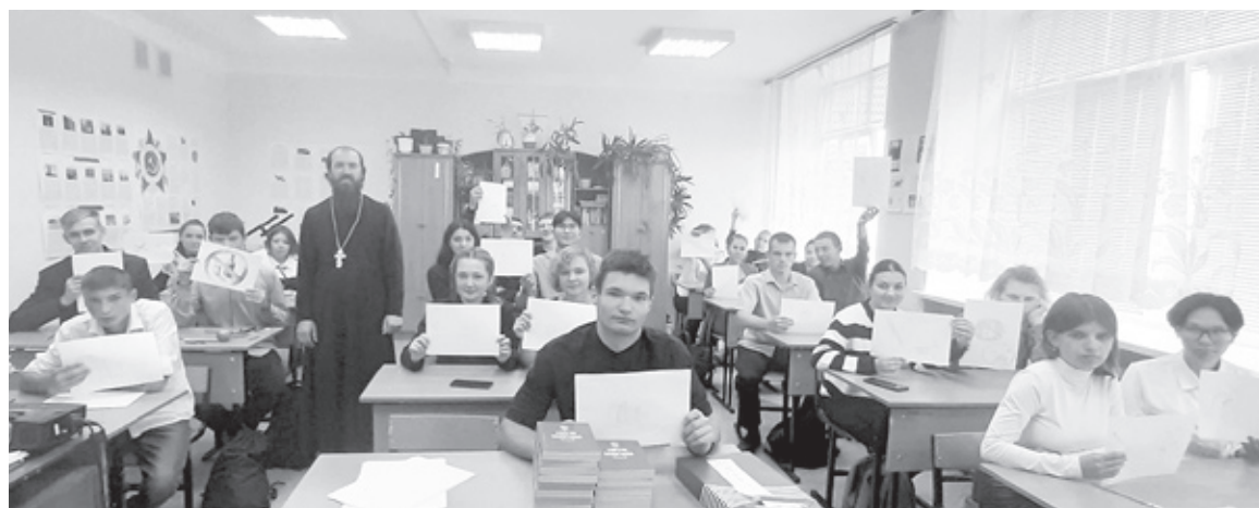
|| Фото из личного архива отца Евгения

8 сентября в рамках празднования Дня трезвости в школе села Солобоево состоялась встреча настоятеля храма в честь Казанской иконы Божией Матери с.Исетское со старшеклассниками.