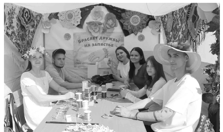
Работники культуры Южно-Плетневской территории провели мастер-класс по плетению браслета дружбы