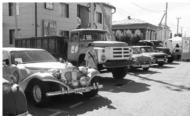
Более десятка машин было представлено на выставке ретроавтомобилей