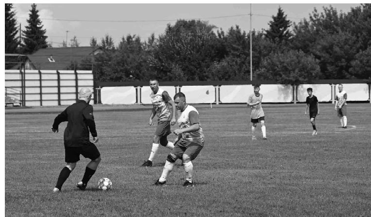
Борьба за мяч на футбольном поле