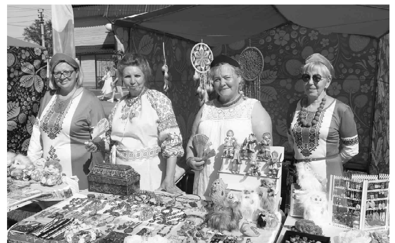
Аромашевские рукодельницы привезли оригинальные украшения, игрушки и другие изделия