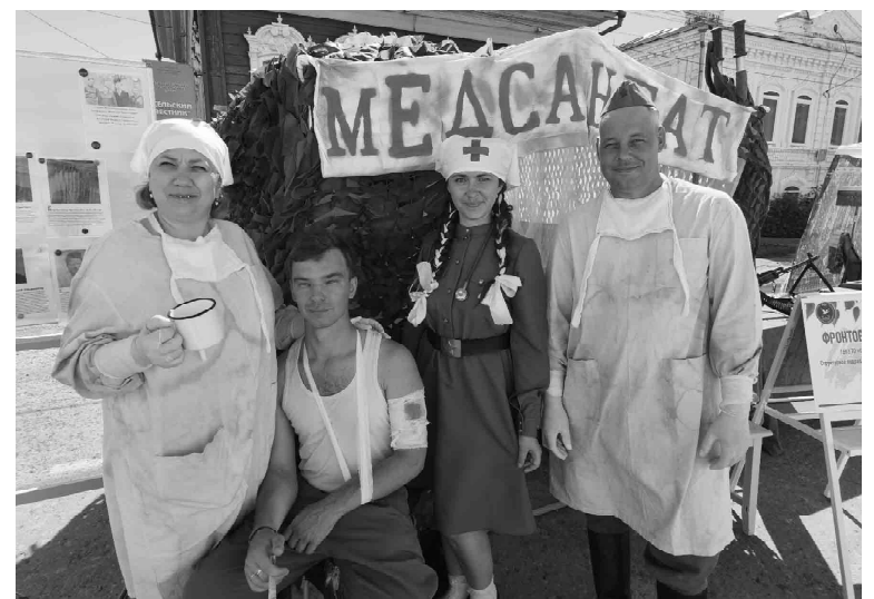
Правдоподобно выглядела реконструкция военного госпиталя, развернутая сотрудниками Омутинской районной больницы