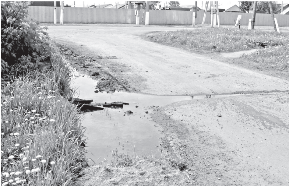
• Устранить аварию без процедуры торгов – значит нарушить закон. И это касается не только ситуации с порывом водопровода в Мичуринском.

по жилищно-коммунальной политике администрации городского округа: