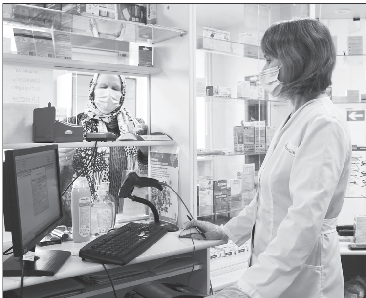
В эти дни поток посетителей в Центральную районную аптеку № 16 минимальный