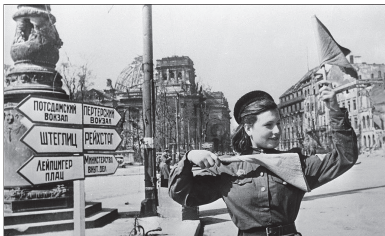
Советская регулировщица в центре Берлина

ное сопротивление. Бои шли днём и ночью. Прорываясь к центру, советские солдаты брали штурмом каждую улицу и каждый дом. В отдельные дни им удавалось очистить от врага до 300 кварталов. Рукопашные схватки завязывались в тоннелях метро, подземных ходах сообщения. Основу боевых порядков стрелковых и танковых частей составили штурмовые отряды и группы.