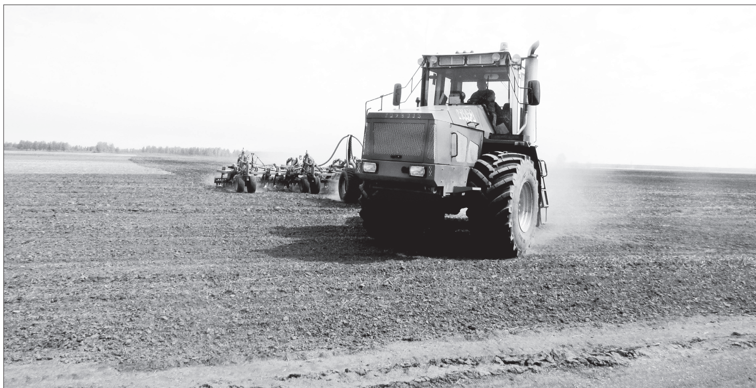
Труженики ООО «Земля» вышли в поле – они занимаются боронованием. В первый день работы заборонено более 120 гектаров

Ольга КОНОВАЛОВА